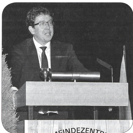
Nationalrat Albert Rösti