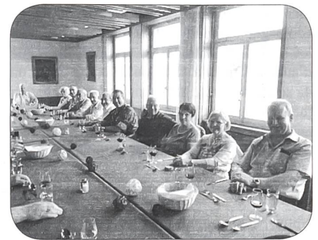
Die Pensionierten / Ehemaligen der «Hellgrünen / Angehörigen Ns Rs» am Mittagstisch bei guter Laune.

brüllen», das haben Sie schon oft gehört. Und wer heute weitermacht, muss sich rechtfertigen. Deshalb ist Ihr Engagement, liebe neue Kader, wie ein Zeugnis. Als neue Kader unserer Armee zeigen Sie, dass junge Schweizer in der Lage sind, gegenüber der Bevölkerung unseres Landes eine grosse Verantwortung zu übernehmen.