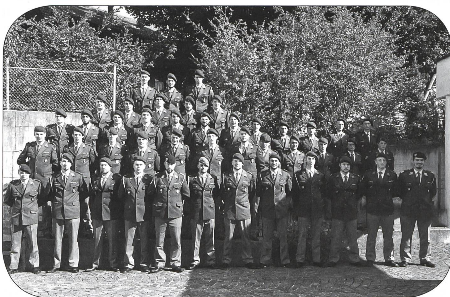
Beförderte Anwärter IH S 50