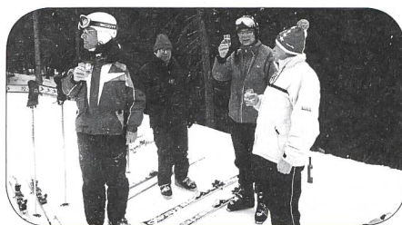
Verres en main