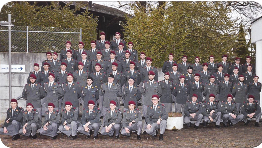
Beförderte höh Uof und Uof