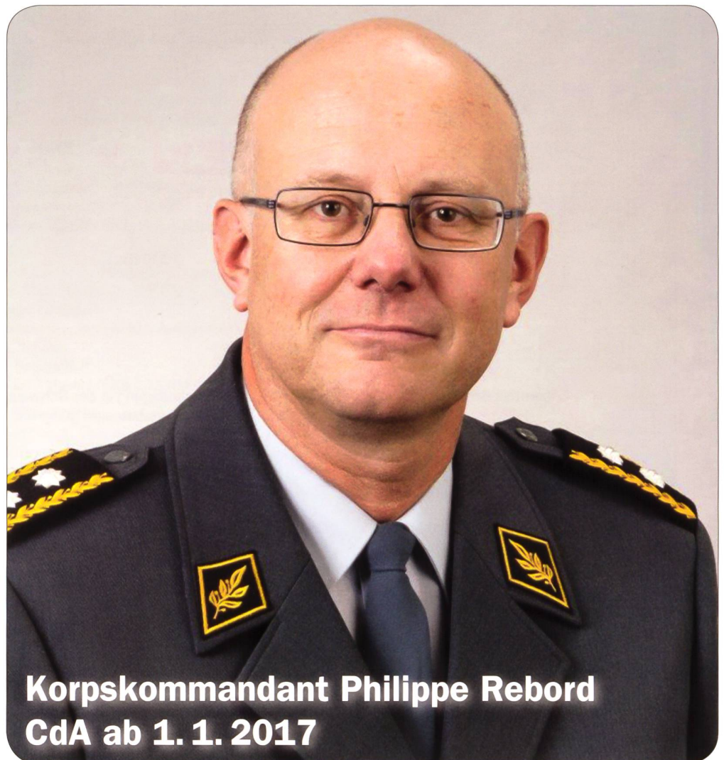
Korpskommandant Philippe Rebord CdA ab 1. 1. 2017