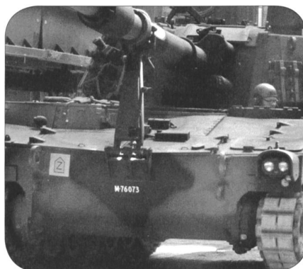
PzHb M 109