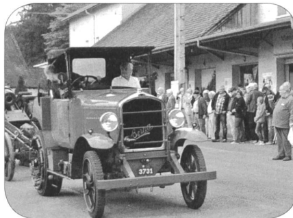
Berna Artillerie Traktor mit Radgürtelkanone

Die Vorführungen beginnen mit der «pferdegezogenen Artillerie», indem eine sechsspännig gezogene 7,5 cm Kanone 1903/22 in Originalbespannung mit Tross und Reitern in Fahrt unterwegs und beim Stellungsbezug zu bewundern ist. Motorfahrzeuge und Kanonen aus sechs Jahrzehnten werden ebenfalls in Fahrt die «motorgezogene Artillerie» in Erin-