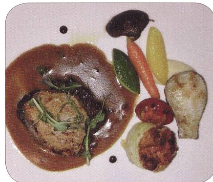
Der 5. Gang