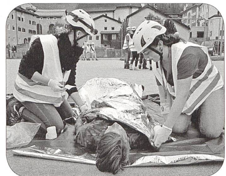
Teamarbeit am Patienten