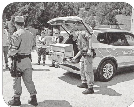
Zusammenarbeit mit der Militärpolizei