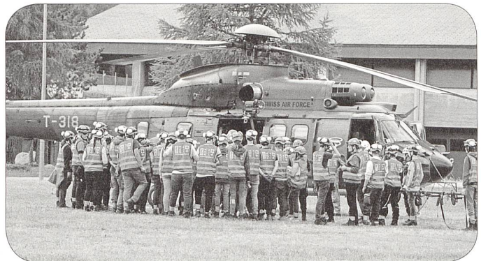
Zusammenarbeit mit der Luftwaffe

ten Kreuzes erbringen einzelne Ausbildungssequenzen. So erhalten die Lagerteilnehmer einen Einblick in deren Aufgabengebiete.