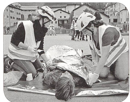
Teamarbeit am Patienten