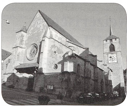
Eglise St. Etienne Moudon

Text und Foto Burkhalter Marc-André, Redaktor Wir vom Train