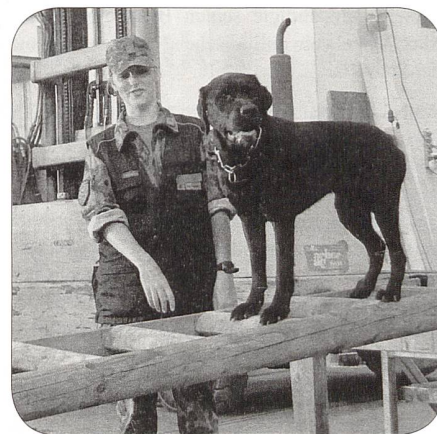
Gang über die Leiter