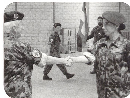
Beförderung zum Soldaten RKD

Die fachtechnische Ausbildung erfolgt anschliessend in den jeweiligen Diensten.