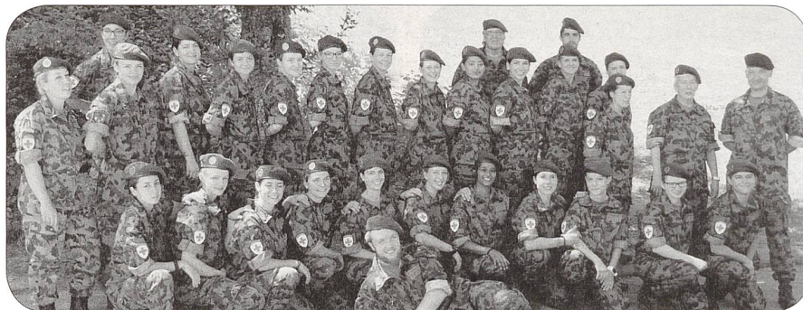
RKD RS 2018

Sie tragen im Dienst die gleiche Uniform wie die Angehörigen der Armee. Anstelle des Truppengattungsabzeichens tragen sie das Rotkreuzabzeichen. Dazu tragen sie das Verbandsabzeichen und das Funktions- und Spezialistenabzeichen. Im