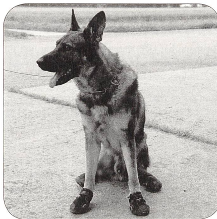
Gasco mit Sicherheitsschuhen

Die Hundfhr Rekr werden in den ersten vier Wochen der RS in der Allgemeinen Grundausbildung geschult. In dieser Phase werden die Vorkenntnisse und die Verhältnisse betreffend der Hundehaltung zu Hause individuell abgeklärt. Daraus wird ein Verhaltensprofil für den Hundefhr und den Hund erstellt. Zu Beginn der fünften Woche wer-