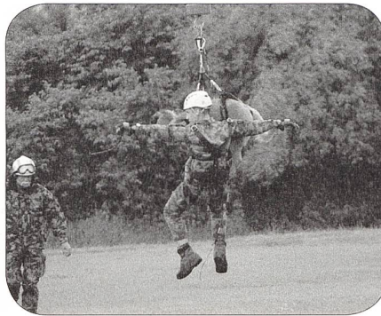
Hund und Hundeführer landen am Boden

den dann die Hunde auf einen geeigneten Rekr (Partner) zugeteilt. In der folgenden Fachgrundausbildung wird das Basiswissen vermittelt. Die Zusammenarbeit und die Teamfähigkeit zwischen dem Rekr und den Hund wird laufend überprüft. Ab dem vierten Wochenende nimmt der Hundefhr Rekr seinen Hund mit ins Wochenende. Der Rekr kauft den Hund von der Armee: Als Besitzer ist er haftungs- und versicherungstechnisch der Tierhalter und trägt die Verantwortung für seinen Hund. Im Verlauf der Basisausbildung werden verschiedene Prüfungen abgenommen, unter anderem wird auch eine Führbarkeitsabklärung gemacht.