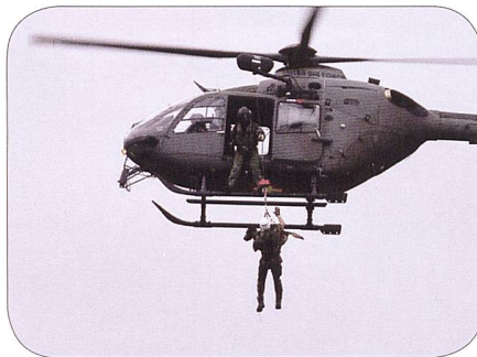
Hundeführer und Hund seilen sich ab