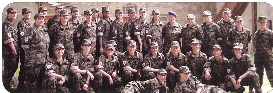
RKD RS Juli 2017