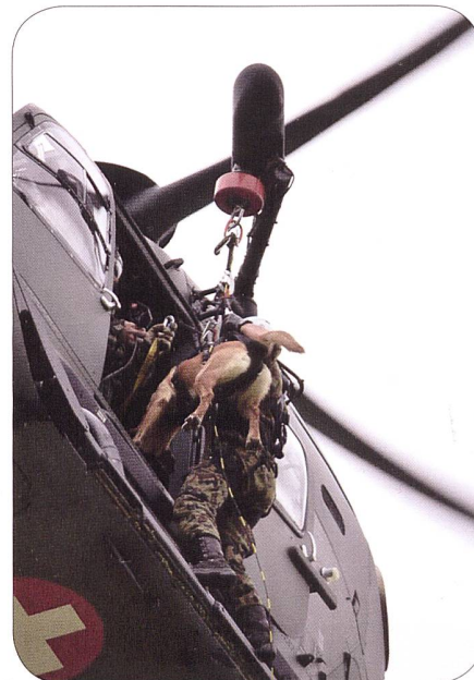
Hundeführer und Hund beim Ausstieg