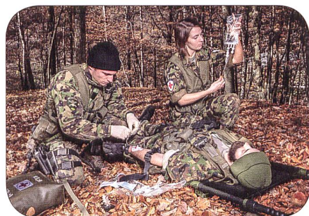
RKD Aerztin im Feld