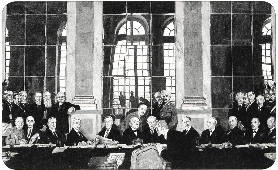
Vertragsunterzeichnung, Spiegelgalerie Schloss Versailles

Durch die Auflösung der beiden alten Staaten Österreich-Ungarn und Osmanisches Reich wurden weitere Friedensschlüsse mit den Nachfolgestaaten Österreich, Ungarn, Bulgarien und der Türkei abgeschlossen; damit entstand in Ostmitteleuropa eine Zwischenzone.