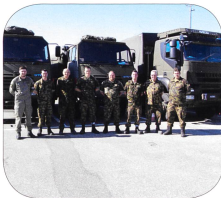
Referententeam Region 3