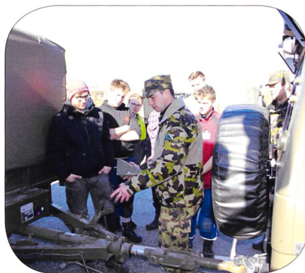
Einführung in FZ Anhänger