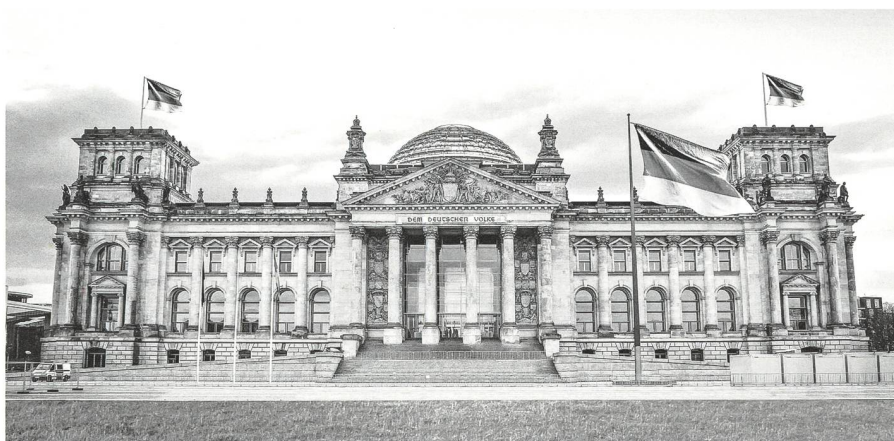
Reichstag in Berlin; Sitz des Deutschen Bundestages

Die Jahresberichte der Wehrbeauftragten enthielten in der Aufbauphase der Bundeswehr oft ein wenig erfreuliches Bild der Menschenführung. Die Bundeswehr wurde unter Einbeziehung von Angehörigen des Bundesgrenzschutzes und der früheren Wehrmacht aufgebaut. Das Konzept der Inneren Führung, nach dem jeder Soldat – auch der Wehrpflichtige – «Staatbürger in Uniform» blieb, war diesen nicht nur neu, sondern wurde auch teilweise abgelehnt. Auch später finden sich in den Berichten Beschwerden von meist wehrpflichtigen Soldaten über Grundrechtsverletzungen und Schikanen durch Vorgesetzte, der Schwerpunkt ändert sich jedoch durch Eingaben von Zeit- und Berufssoldaten zu Personal-, Fürsorge-, Laufbahn- und Statusfragen. Die Zahl der Beschwerden wuchs auf einen Jahresdurchschnitt von 6000. Die Behörde des Wehrbeauftragten wuchs entsprechend und legte den