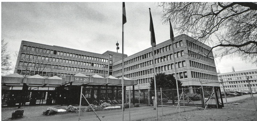
Pentagon der Schweiz, Papiermühlestrasse 14 + 20, Bern

zugehen, dass sie auch nicht die Schranken von Art. 23b Abs. 3 des Bundesgesetzes über Massnahmen zur Wahrung der inneren Sicherheit (BWIS) einhalten.