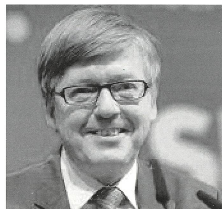
Wehrbeauftragter des Deutschen Bundestages, Dr. Hans-Peter Bartels