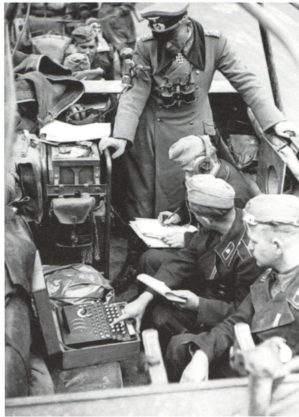
General Guderian wartet auf eine Entschlüsselung eines Funkspruchs (1940)

Ab 1932 reiste Hagelin durch Europa, um Käufer zu finden. Die französische Armee zeigte Interesse, verlangte jedoch Modifikationen, insbesondere zwei Bedingungen: Die Maschi-