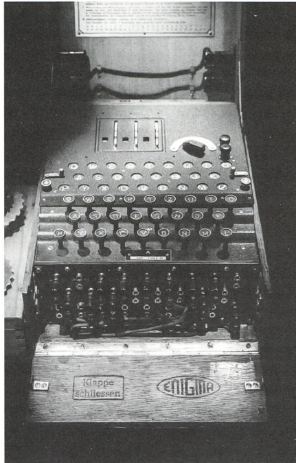
Enigma Quelle Bletchley Park

Die Geschichte der Kryptografie kann in drei Epochen aufgeteilt werden. In der ersten wurde per Hand (z.B. mit Papier und Bleistift oder mit mechanischen Scheiben) verschlüsselt, in der zweiten (ca. 1920–1970) wurden spezielle Maschinen verwendet, in der dritten (ca. seit 1970) übernahmen Computer eine zentrale Rolle. Die Kryptoanalyse bildet das ergänzende Ge-