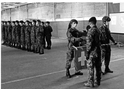
Beförderung der Küchenchefs

Le clé du succès est une subsistance bonne qui influence de manière positive le moral de la troupe.