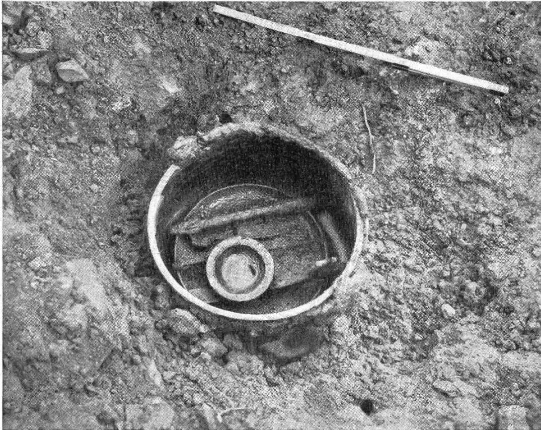
Abb. 24. Entfelden: Bronzegeschirrdepot aus römischen Kriegszeiten.

von Dr. Paul Ammann aus Aarau mit Notstandsarbeitern von Muhen diesen Herbst wieder aufgenommen worden. Ueber die topographischen Ergebnisse werden wir in der nächsten Nummer berichten. Für heute möchten wir unsere Leser nur mit einem originellen Neufund bekannt machen. Abbildung 24 zeigt einen römischen Bronzekessel, der im Boden vergraben war und ein ganzes Depot von Bronzegefäßen und Werkzeugen enthielt. Offenbar hat ein durch kriegerische Ereignisse verängstigter Bewohner des Hofes diese ihm wertvollen Gegenstände der Erde anvertraut und wurde durch das Schicksal verhindert, den Schatz wieder zu heben. Solche Bronzegeschirrdepots sind übrigens nicht einmal so selten. Aehnlich wie die Münztöpfe vermögen sie der Forschung Auskünfte über die Zeit und den Verlauf alamannischer Kriegszüge in die römische Schweiz zu geben.