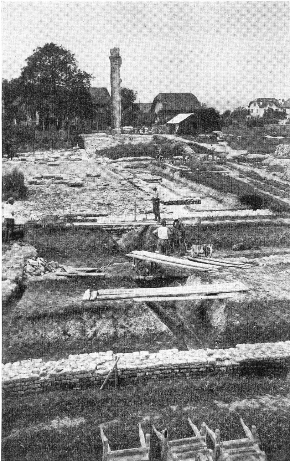
Fig. 23. Avenches. Les fouilles de l'an 1939. Au fond le Cigognier, au centre l'avenue dallée, au premier plan le mur du portique.