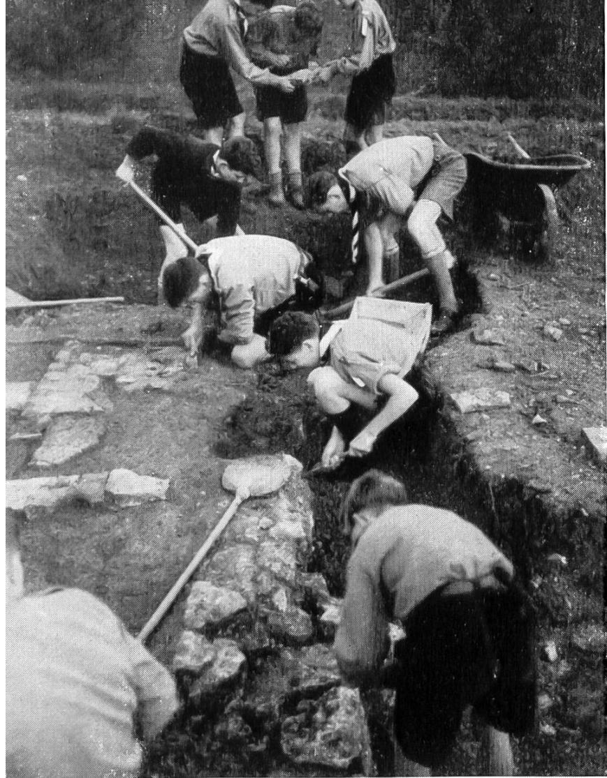
Abb. 36. Lausen. Basler Pfadfinder als Ausgräber.