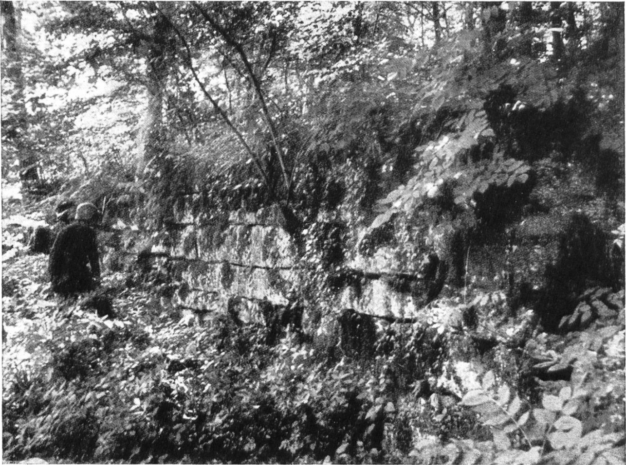
Abb. 5. Römerbrücke oberhalb Pont Perret bei Fresens.