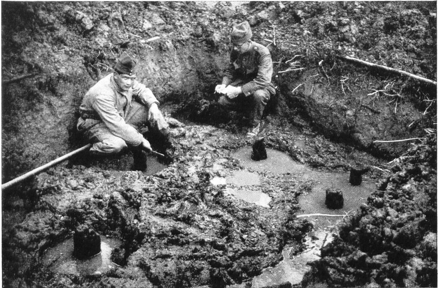
Abb. 6. Cudrefin – Le Broillet. Vermessen des Pfahlbaues.