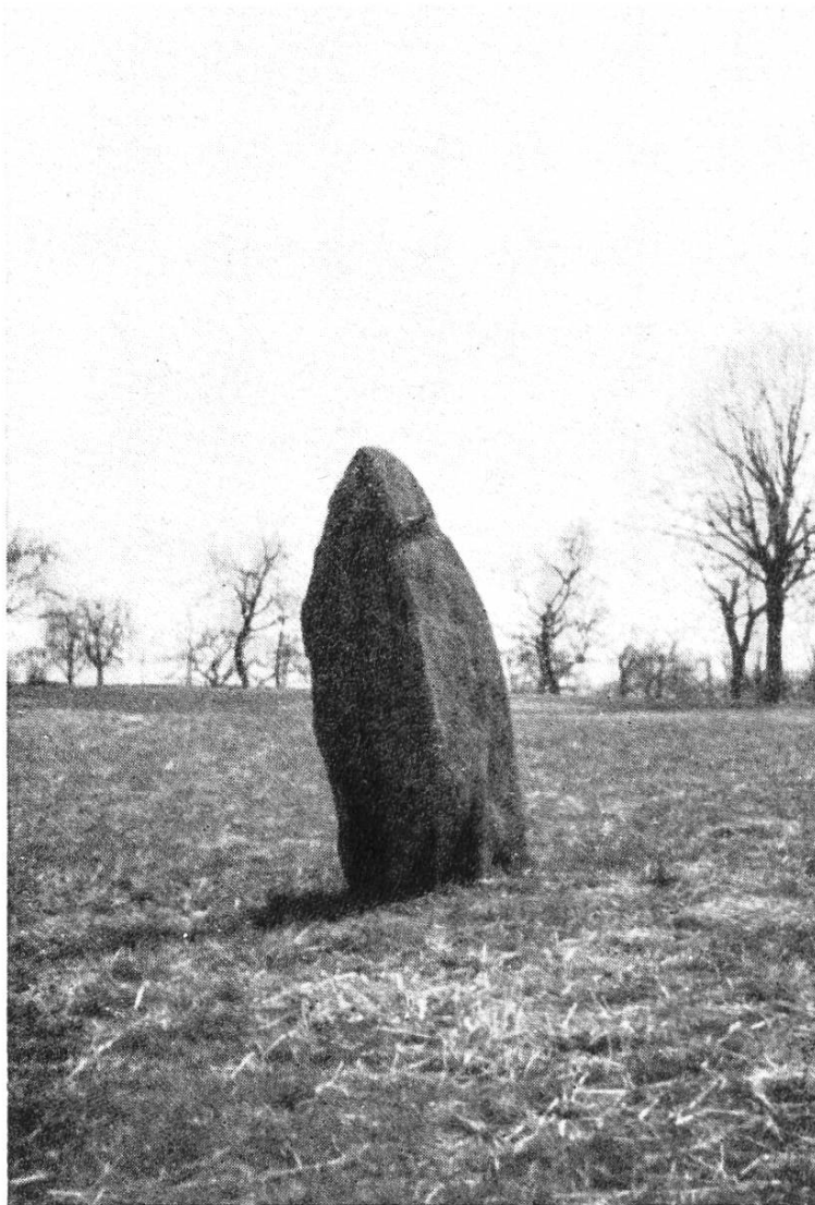
Abb. 3. Le Devens, oberhalb St. Aubin (Neuenburg), Menhir beim Asyle.

Aeussere Ereignisse zwangen zu Pfingsten 1940 zum Abbruch der Arbeiten. Als zweite Etappe war eine Reihe von Sondiergrabungen vorbereitet; die zweite Generalmobilmachung verhinderte die Ausführung, ebenso die Verwirklichung des dritten Projektes, die Vermessung der Römerstrasse, die als „vy de l'Etraz“ den Abschnitt durchquert 1) . Aber wie auf dem Feld der Megalithdenkmäler die wichtigste, wohl nur mit militärischen Kräften ohne übermässige Kosten