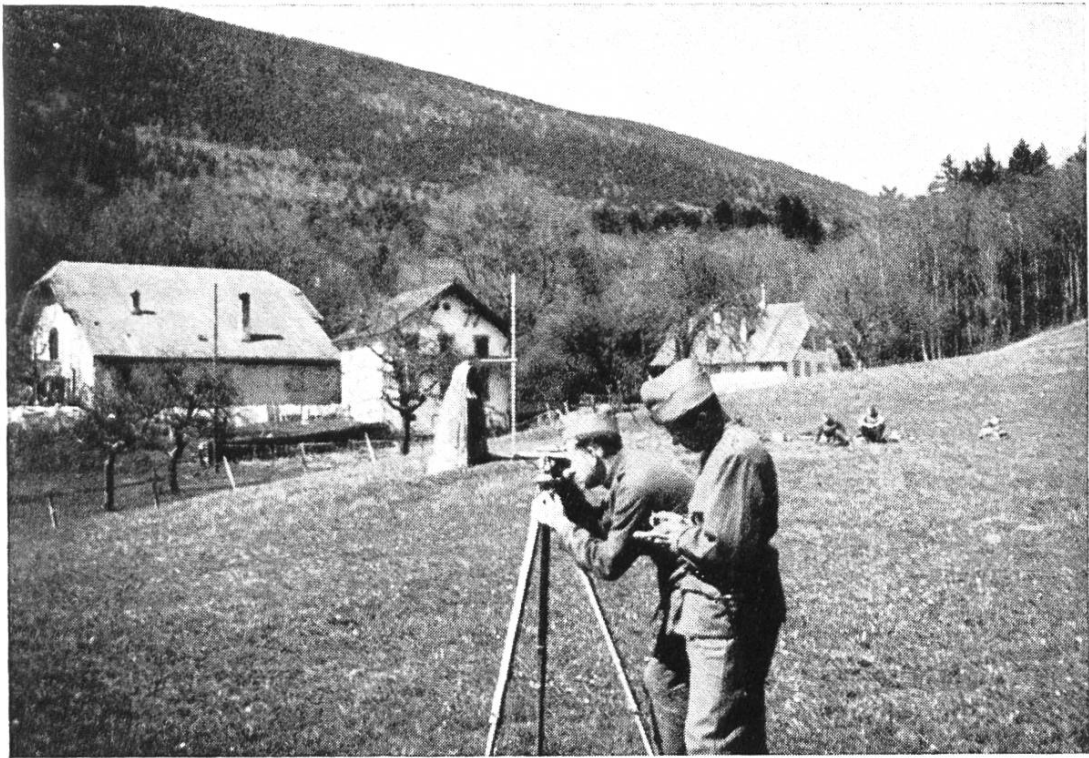
Abb. 1. Menhir von Vauroux. Feldmesser mit Richtkreis.