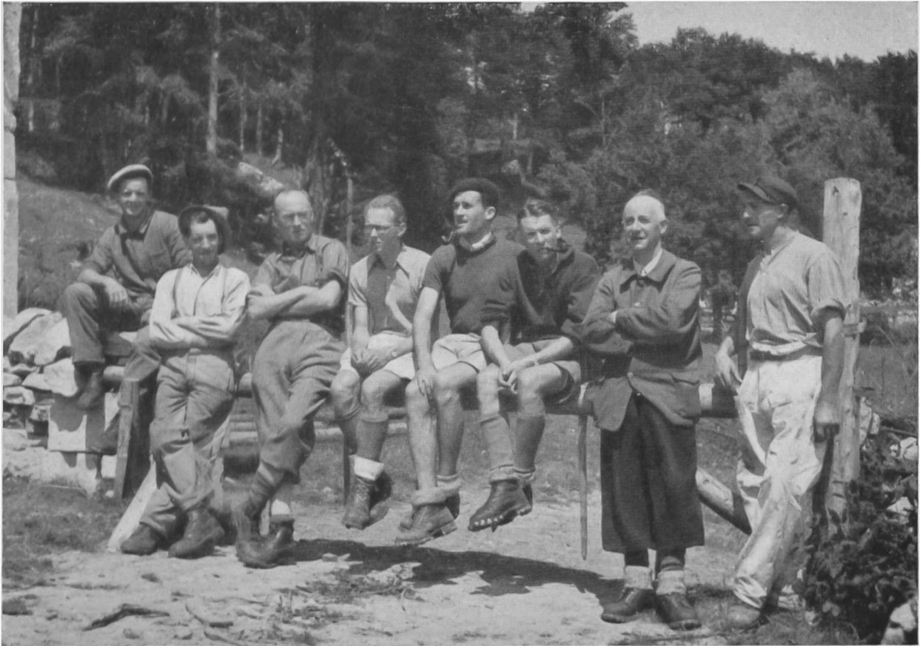
Fig. 9. L'équipe du premier camp archéologique de l'Institut à Vernand sur Mont-la-Ville (Vaud). — Erstes Schulungslager des Institutes: Archäologen und Arbeiter kameradschaftlich vereinigt.

trouvailles qui les incitent à d'intéressantes observations. La bibliothèque rend alors de grands services. En été, l'institut organise des excursions et visite des fouilles ou des musées dans les environs de Bâle ou dans un plus vaste rayon.