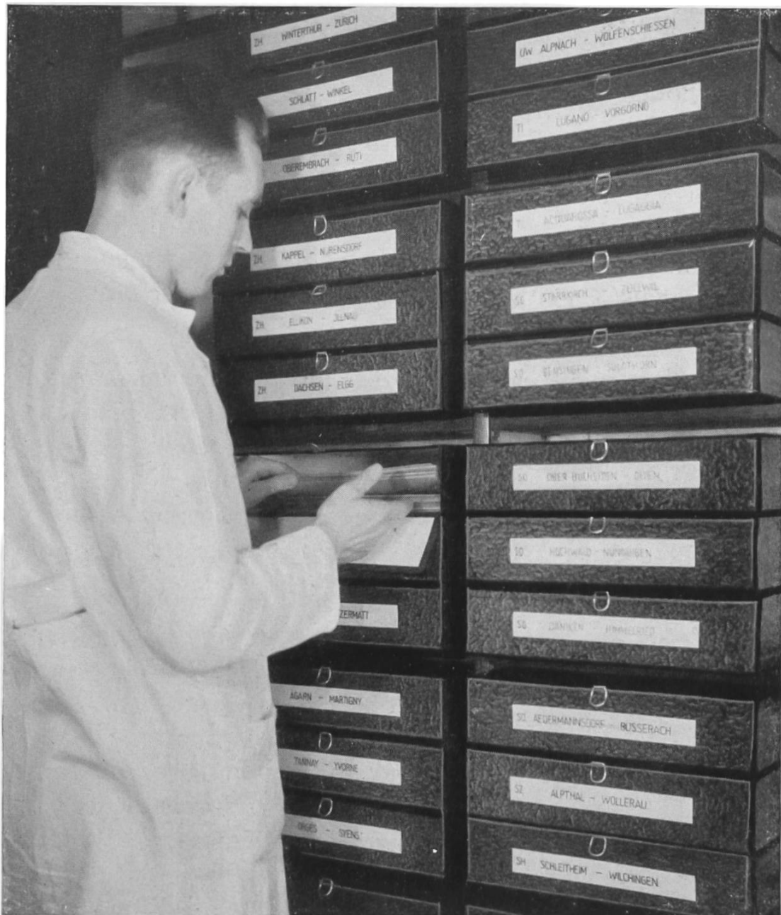
Fig. 2. Die Landesaufnahme. — Les archives topographiques.

Daneben möchte sich das Institut auch für die Auswertung des Fachwissens für die Allgemeinbildung einsetzen. Wohl jedermann kommt irgend einmal mit Bodenfunden oder Ausgrabungen in Berührung. Der Unwissende steht davor zumeist wie vor vernagelten Türen. Dem Kenner bedeuten sie eine Bereicherung seiner Einsicht in die Zusammenhänge