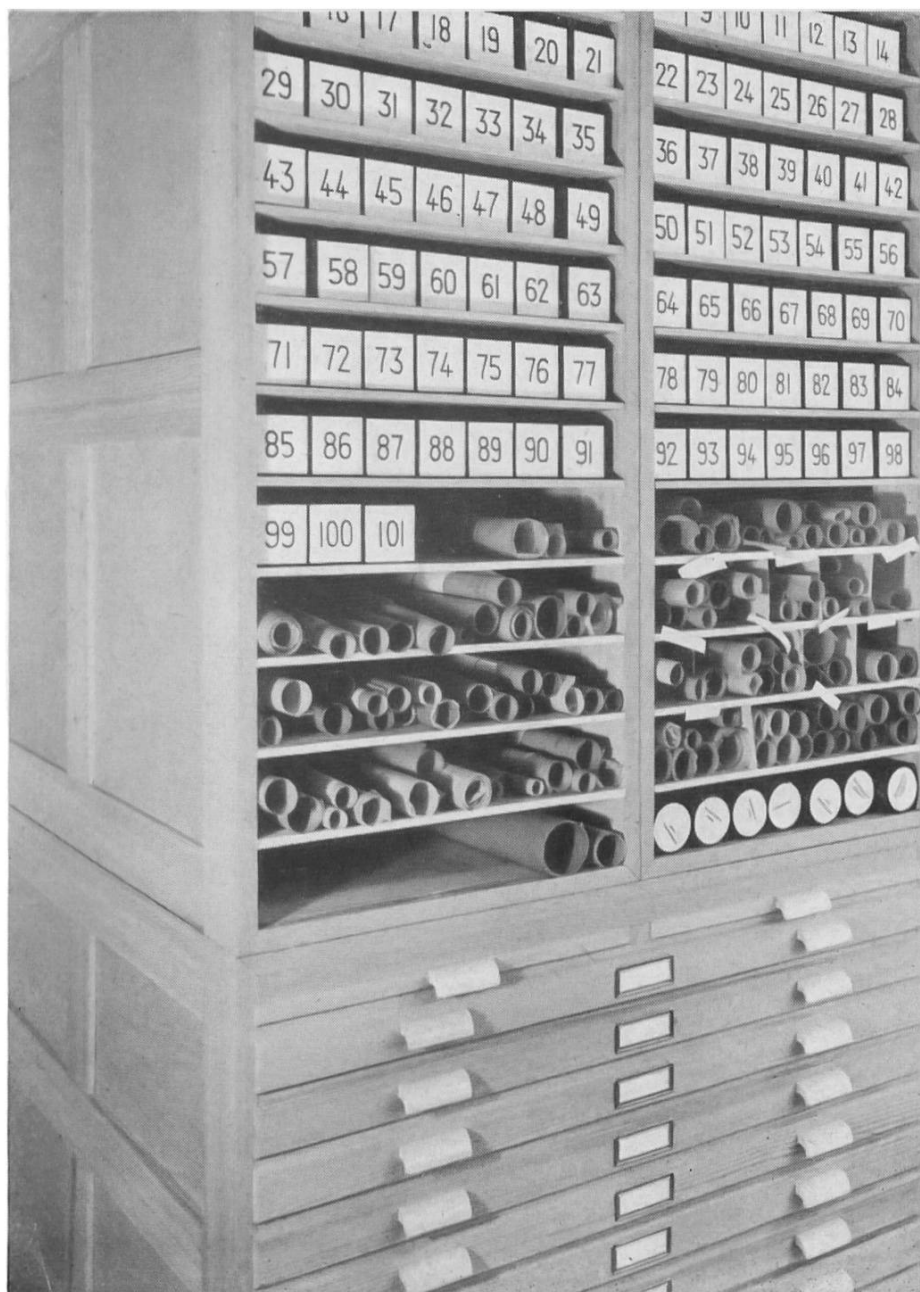
Fig. 3. Das Planarchiv. — Les archives des plans.

8. Ausbildung junger Archäologen. Es muss als ein besonderes Privileg gewertet werden, dass jungen Urgeschichts-Beflissenen die Möglichkeit geboten ist, am Institut gegen ein, allerdings bescheidenes, Entgelt eine Lehrzeit durchzumachen und in alle Gebiete der Forschung