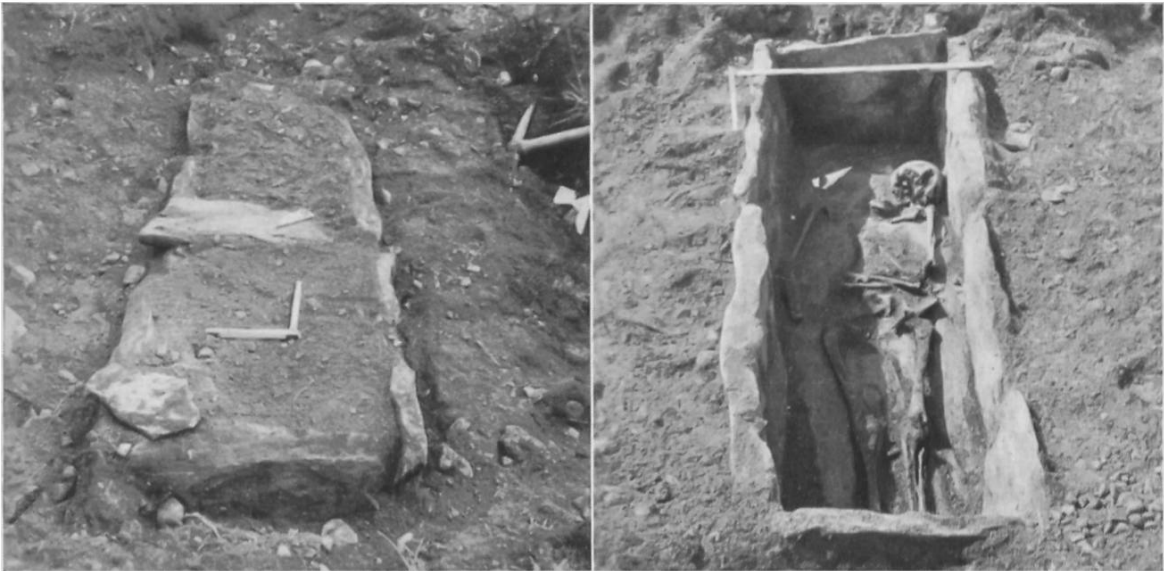
Fig. 29. Bassins (Vaud). Tombe burgonde.