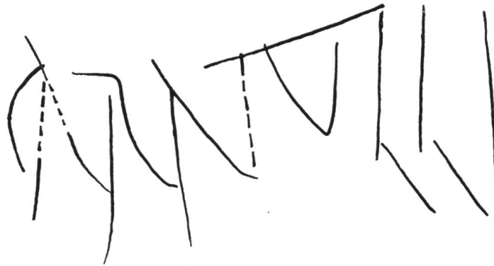
Fig. 10. Yverdon. Graffite CARATULLI sur cruche.