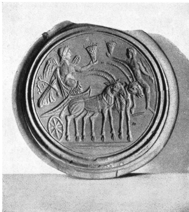
Abb. 25. Ziegen- oder Gazellengespann auf römischem Model aus Carnuntum (vgl. Anm. 2).

gewesen sein, nach dem Ziegenleder zu beurteilen, das sich in Vindonissa vorfand. – Die Römer liebten Tiergespanne aller Art, sie waren auch Meister der Dressur. – Ein im Louvre sich befindliches Relief eines Kindersarges weist ein Schafgespann auf 1) ). Zwar handelt es sich um einen Zweispänner. Aufzäumung und Bespannung sind allerdings verschieden von unserem Beispiel. Wegen der Kleinheit des Bildes sind die Einzelheiten jedoch nicht erkennbar. Übrigens sind die Gespanne und Reitzeuge auch auf andern Grabdenkmälern meist unvollständig, d. h. in vernachlässigter Art wiedergegeben. Man kann jedoch meist das unvollständige Geschirr rekonstruieren. – Das hier zur Diskussion stehende Beispiel eines Gespannes mag ein Novum sein, vielleicht mehr nur eine Spielerei. Wahrscheinlich findet sich irgendwo ein Ziegengespann abgebildet, wenn auch mit anderer Beschriftung. – Wer kann ein solches zur Bestätigung dieser Auslegung angeben? 2) A. Gansser-Burckhardt.