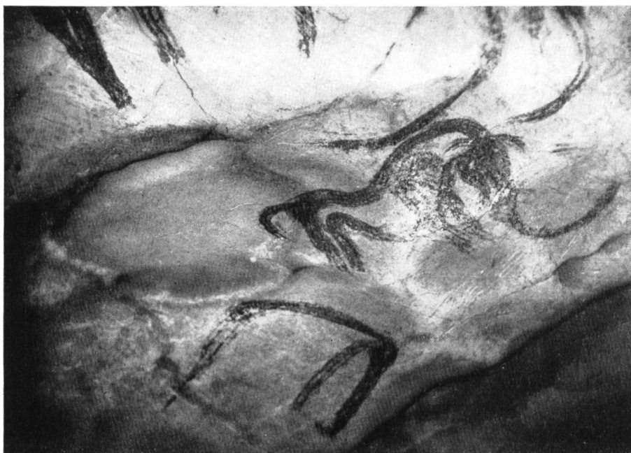
Fig. 57. La Baume Latrone (Gard). Fragment de la grande fresque des éléphants, de style schématique.