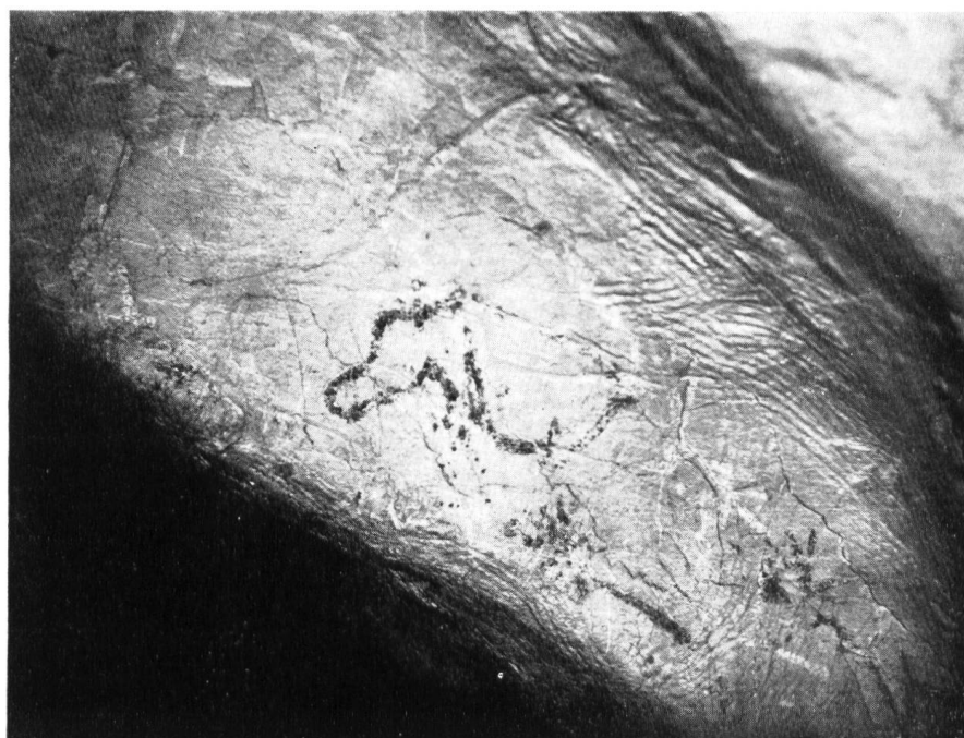
Fig. 58. La Baume Latrone (Gard). Peinture plus naturaliste, isolée. Rhinocéros ?