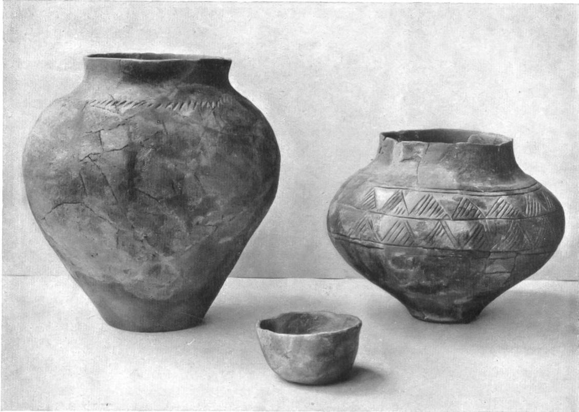
Abb. 41. Däniken. Gefäße der Spät-Hallstatt-Zeit aus Grabhügel 2. (Im Hist. Museum Basel restauriert.)