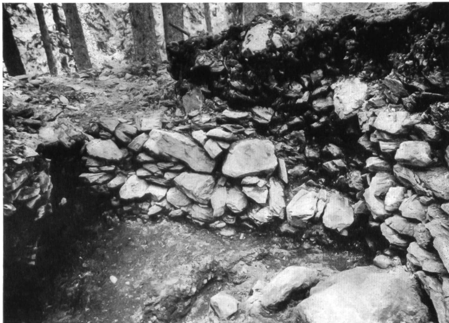
Abb. 11. Caschlins. Quermauer am Nordende.