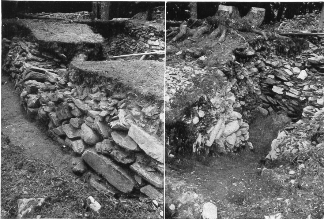
Abb. 8. Caschlins, Hauptmauer der Ostfront, äussere Ansicht.