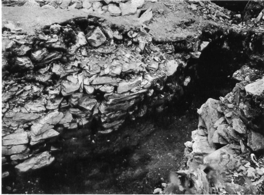
Abb. 10. Caschlins. Nordende. Abweichende Westmauer und Quermauer durchstossen.