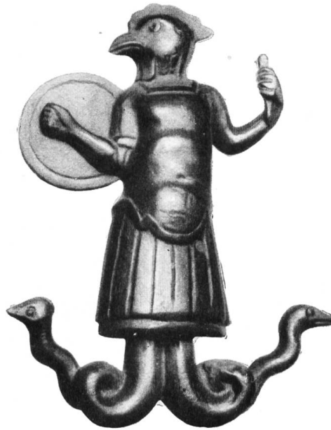
Abb. 12. Avenches. Abraxas-Bronze, Museum Lausanne. Aus F. Stähelin, Schweiz in röm. Zeit, 3. Aufl. S. 560.

sei hier eine Bronzeplastik aus Avenches wiedergegeben, die in mehr naturalistischen Formen das gleiche gnostische Wesen darstellt. Hier ist der Rumpf der eines Soldaten. Der Hahnenkopf mag das Sinnbild des Lichtes und des Guten sein, die Peitsche die Macht, der Schild die Weisheit, die Schlange den Verstand bedeuten (Abb. 12).