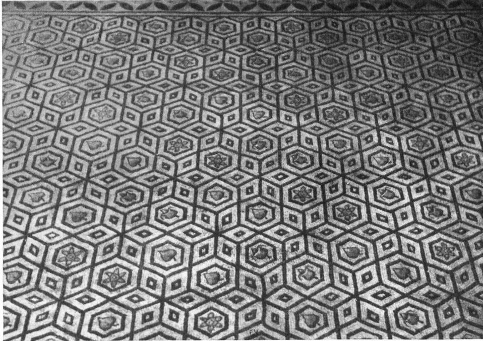
Abb. 15. Zofingen. Römischer Mosaikboden, gefunden 1826.

Imitationen aus der ersten Hälfte des 1. Jahrhunderts gehören, die zu Tage traten. Damit ist es wahrscheinlich gemacht, daß der umfangreiche Badeflügel ein späterer Anbau ist.