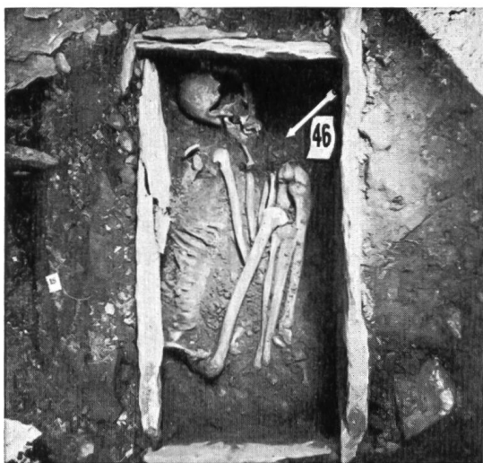
Fig. 33. Collombey-Barmaz I. Tombe néolithique n° 46, au squelette fortement replié.

Si les fouilles de 1950 n'ont pas amené de découverte originale, elles n'en ont pas moins été utiles. Elles ont permis d'augmenter le nombre des tombes néolithiques de quatre (fig. 33-34) et de celles du Bronze d'une (fig. 35), et de délimiter, du côté SE, la nécropole de Barmaz I (seule fouillée cette année).