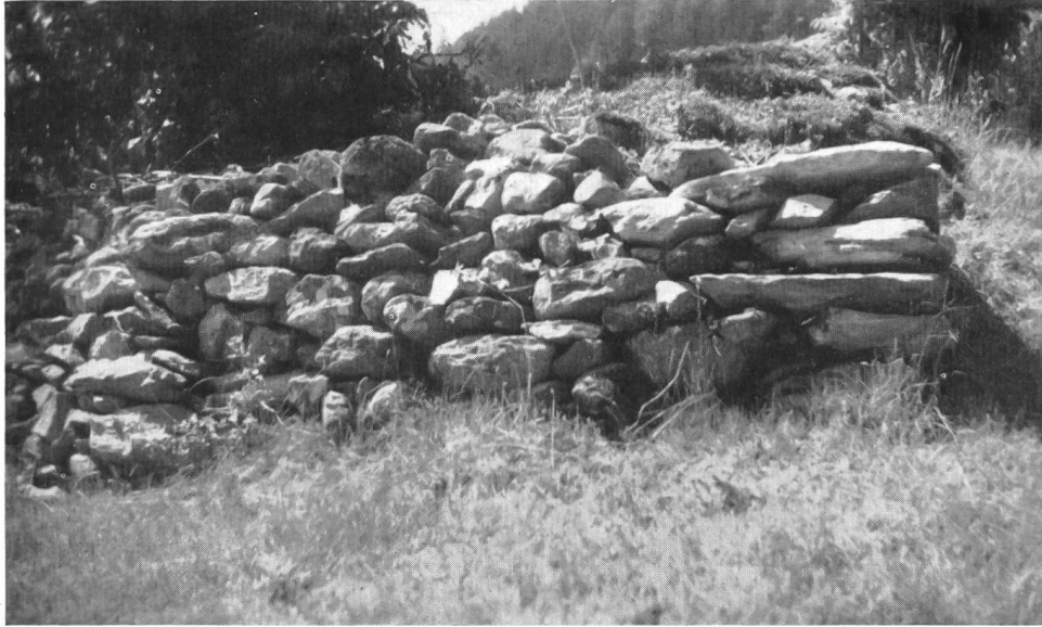
Fig. 7. Le mur B, vu du côté nord.