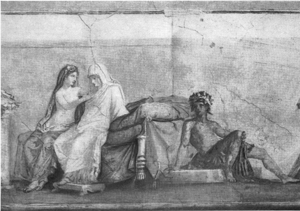
Abb. 14. Rom. Mittelbild der aldobrandinischen Hochzeit (nach A. Maiuri, Pomp.Wandbilder, Taf. I).

Trauer, sondern banges Zögern vor dem kommenden Erlebnis. Hymenaeus, der kraftvolle Jüngling und ernstere Bruder des Eros, hat sich zu ihr gesetzt, um ihr zuzureden und den Bann ihres Herzens zu lösen.