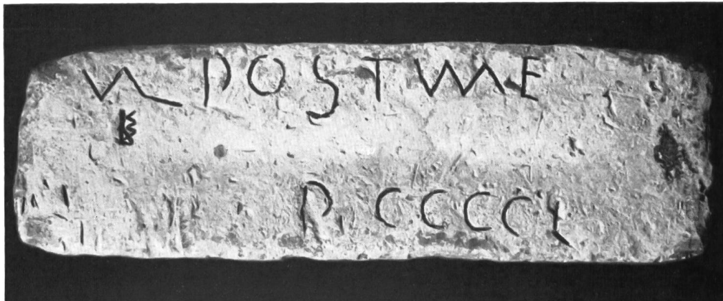
Abb. 29. Arbon. Römischer Bleibarren mit beschrifteter Oberseite.

Die quantitative Analyse ergab eine Reinheit von 99,5 %, die Spektralanalyse Spuren von Kupfer, Silber und Zinn, wobei die beiden ersteren vorherrschend sind.