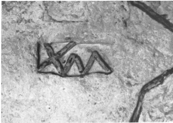
Abb. 30. Arbon. Stempel des Bleibarrens.