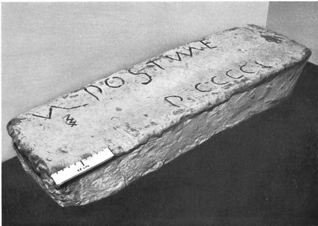
Abb. 28. Arbon. Bleibarren.