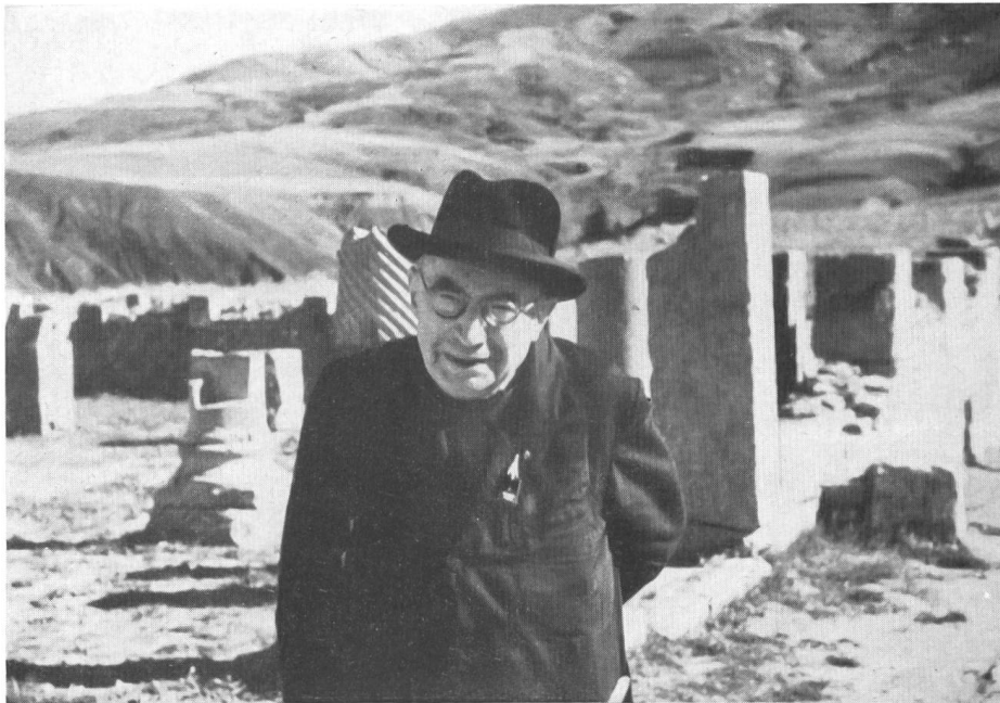
Abb. 19. Abbé H. Breuil, der berühmte französische Prähistoriker, am panafrikanischen Kongress.