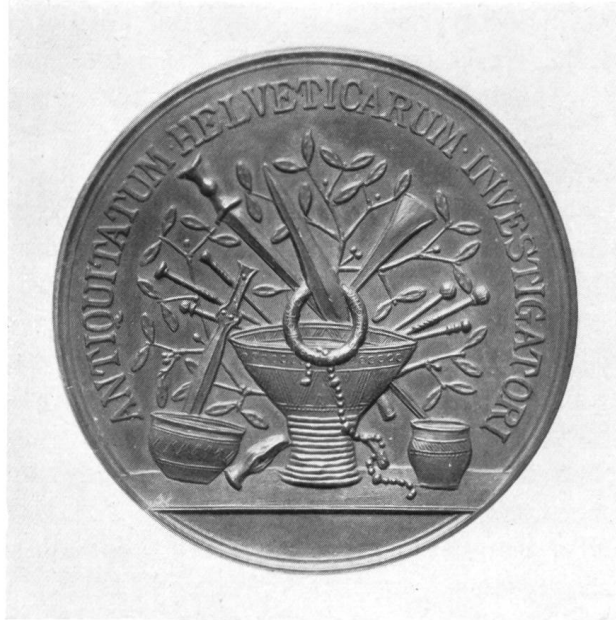
Abb. 22. Erinnerungsmedaille für Ferdinand Keller, Rückseite (vgl. Titelbild).