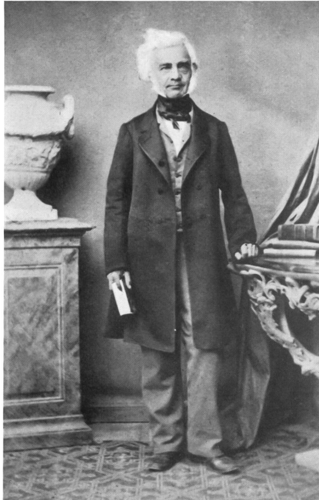
Abb. 17. Ferdinand Keller in der Vollkraft seiner Jahre.

Archäologie eine Wissenschaft bleibt. Bald handelte Keller über «Römische Gebäude bei Kloten», bald über Gräber, bald über älteste Waffen aus Stein und Bronze, bald aber auch über die Architektur des Grossmünsters in Zürich. 1841 verlieh er den «Mitteilungen der Antiquarischen Gesellschaft in Zürich» ihre