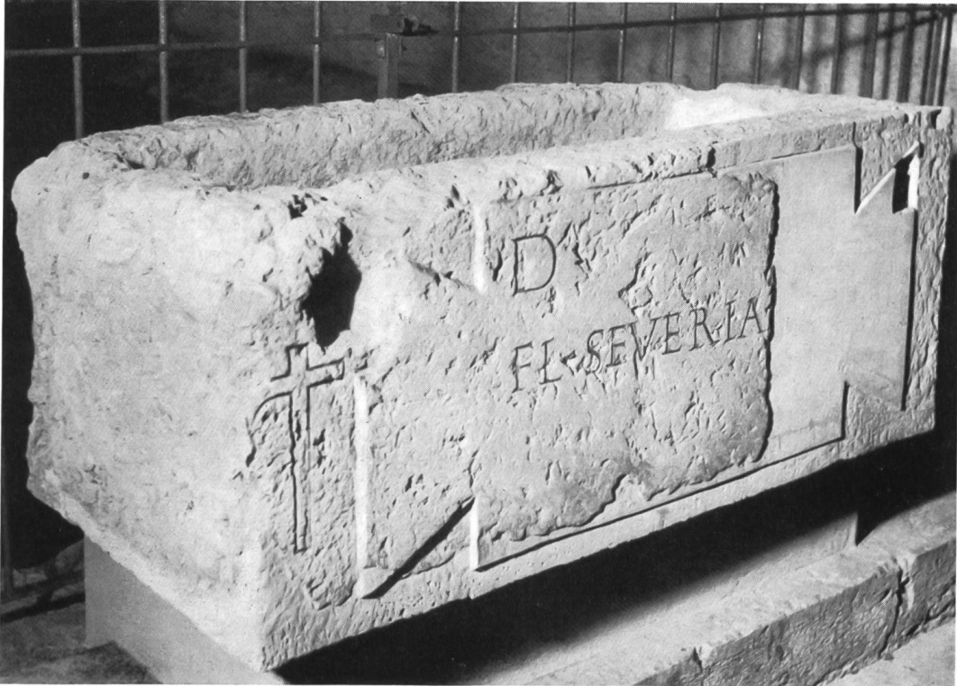
Abb. 47. Solothurn. Römischer Sarkophag der Fl. Severiana. Heutiger Zustand.

Den jüngsten Fund verdanken wir den Instandstellungsarbeiten in den Anlagen zum neuen Gewerbeschulhaus. Der Zugang zum alten «Rollhafen» war eingesäumt von 2 Mäuerchen aus Quadersteinen, die von den wachsenden Wurzeln der schattenspendenden Kastanienbäume arg verschoben waren. Bei Erneuerung dieser Einfassung entdeckten die Arbeiter an einem dieser Quader die Inschrift: