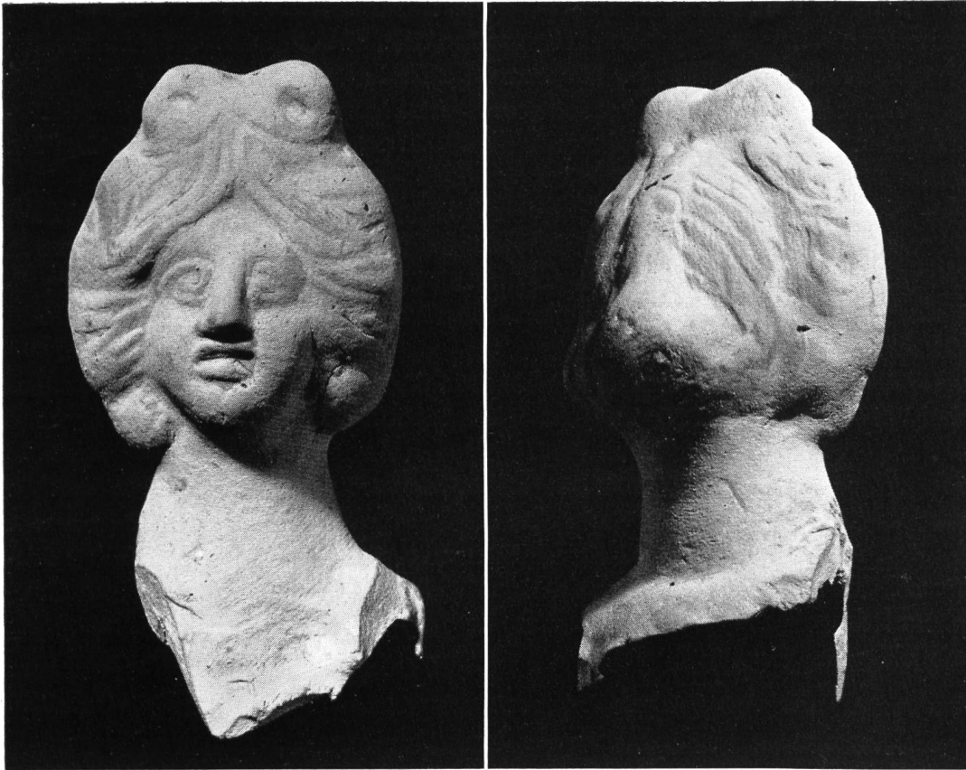
Abb. 37. Vidy. Bruchstück einer Tonstatuette, 1956 gefunden, natürliche Größe.

das bewegliche Hab und Gut der allerersten Bewohner der Colonia Julia Equestris, der nahen Hafenstadt Nyon bieten, das uns infolge der Überbauung dieser Stadt noch so gut wie unbekannt ist.