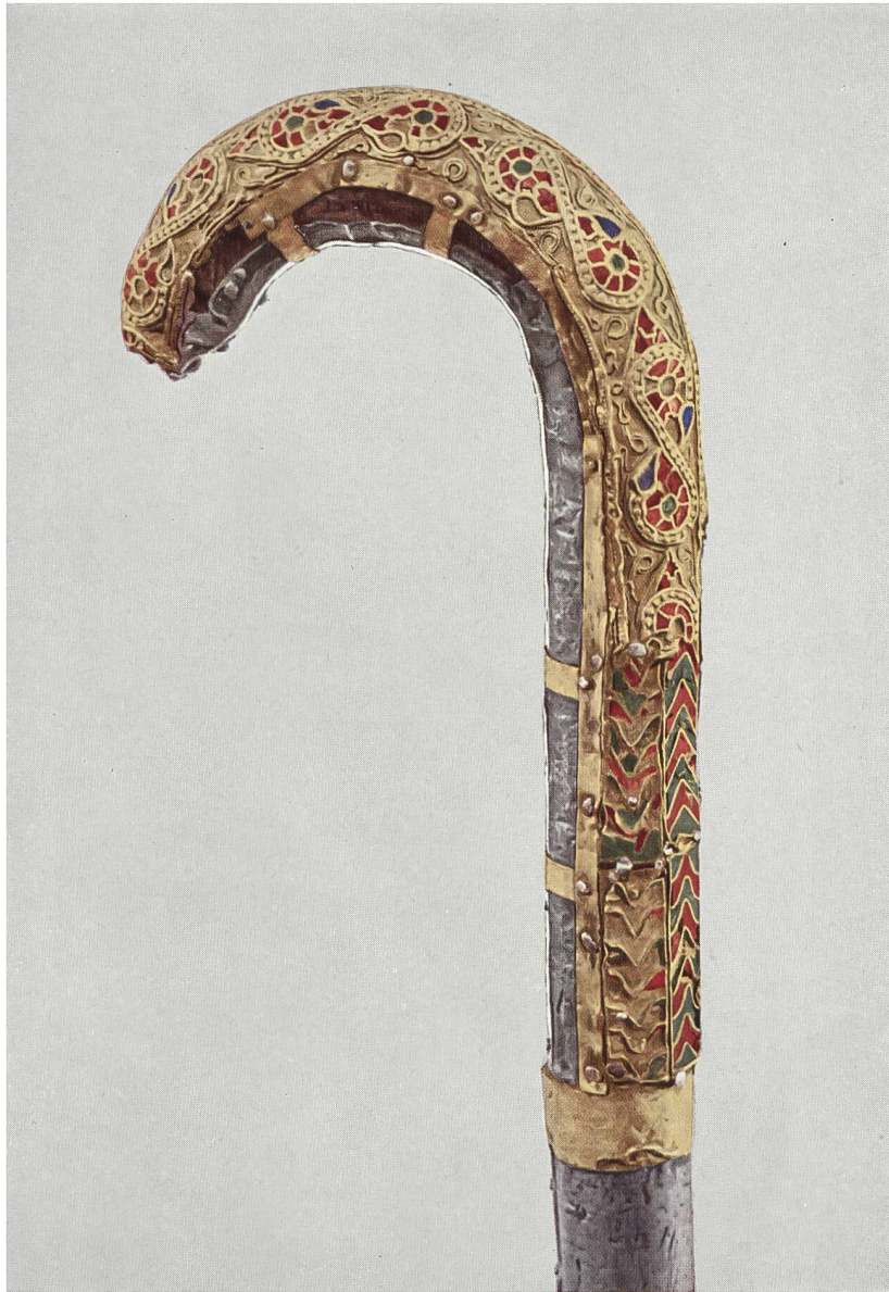
Der Abtstab von Moutier-Grandval aus dem 7. Jahrhundert n. Chr., aufbewahrt im Kirchenschatz von Delémont, Kanton Bern