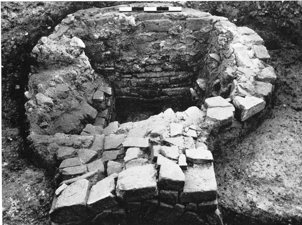
Abb. 33. Vindonissa, Ausgrabung 1956, Röm. Töpferofen II, quadratische Form.