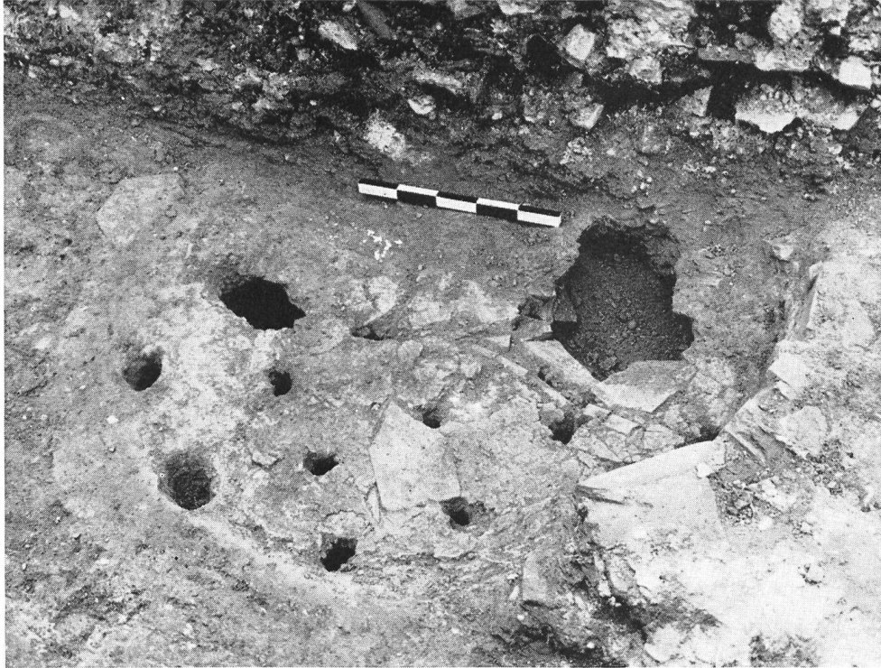
Abb. 31 Vindonissa, Töpferofen I, Ofenplatte aus Lehm und Ziegeln.

Zwei wohlerhaltene Töpferöfen fanden sich in die Kammern des Legionsbau eingefügt und zwar so, daß kein Zweifel bestehen kann, daß sie später als dieser Bau sind.