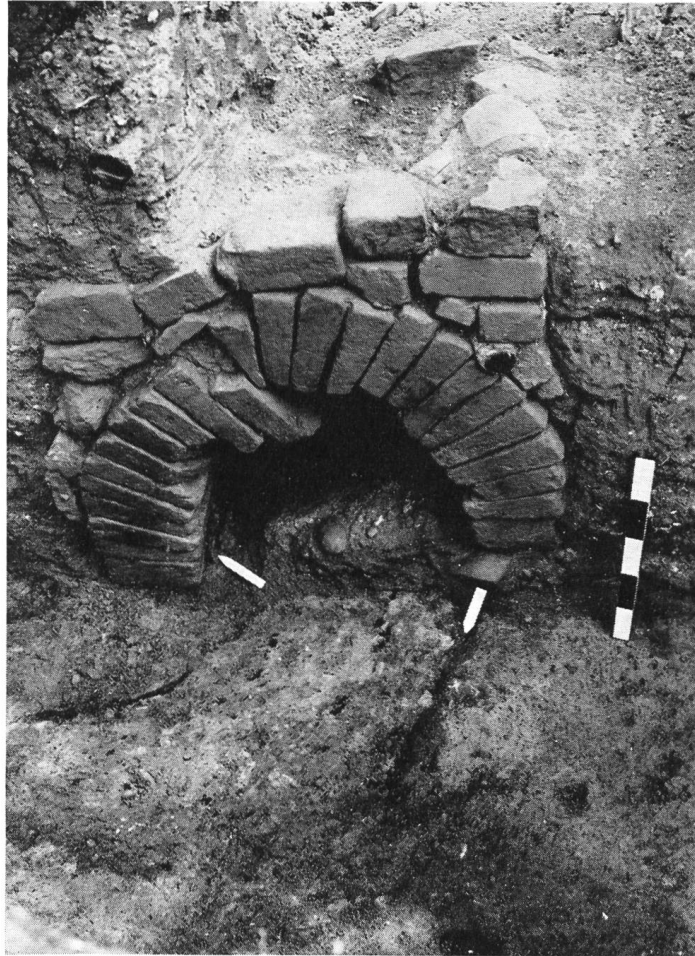
Abb. 34. Vindonissa, Töpferofen II, Einfeuerungskanal.

Kuppel geschlossen wurde und die Feuerung begann. Nach dem Brennen mußte die Kuppel teilweise wieder aufgebrochen werden – dies wohl an einer dafür schon vorher vorbereiteten Stelle – damit die gebrannte Keramik herausgeholt werden konnte.