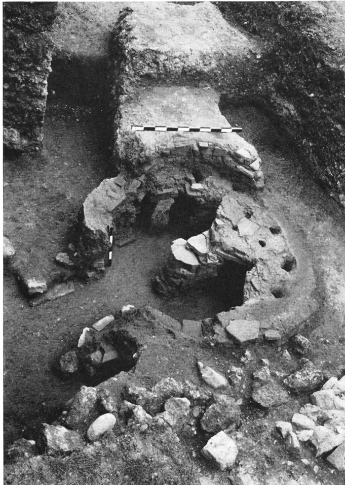
Abb. 30. Vindonissa, Ausgrabung 1956, Röm. Töpferofen I, runder Typus.

Hier hat die große Ausgrabung dieses Sommers, die der Aufdeckung des Zentralgebäudes des Legionslagers galt, einige neue, recht interessante Aufschlüsse gebracht, über die, da sie ja nicht die Bauten des Legionslagers betreffen, hier bereits der Publikation vorgreifend berichtet werden soll.