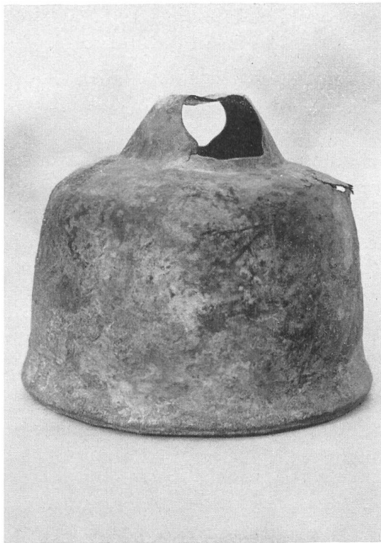
Abb. 40. Augst, römische Glocke aus Bronze (gefunden 1945). H: ca. 13 cm.

Zunächst galt es nach der Form der alten Glocke ein Holzmodell anzufertigen. Da diese jedoch deformiert war, mußte an der besterhaltenen Stelle des Umfanges das Profil abgenommen und nach diesem die Holzform gedrechselt werden. Die oben auf der Glocke aufsitzende Haube ist sehr dünnwandig, und von dort bis zum untern Rande verdickt sie sich nur allmählich, bis sich die Wandung schließlich am untern Rande zu einer eigentlichen Rippe ausbildet. Daher war die Nachformung im Sande durch den Gießer besonders schwierig. Mit Hilfe des positiven Holzmodelles, das die gleiche äußere Form wie die Glocke aufweist, wurde zunächst im Sande ein negativer Abdruck hergestellt, hierauf in diese Hohlform ein ganzer Kern eingestampft, der, wie auch bereits vorher das Modell, durch die Trennung der zweiteiligen Sandform wieder frei bekommen werden konnte. An dem nun so erhaltenen Kern mußte von Hand auf der gesamten Oberfläche eine der Wandung entsprechende Schicht abgenommen werden. Nach dieser Methode kann zwischen Kern und Mantelform ein Hohlraum geschaffen werden, in dem später die flüssige Glockenspeise aufgenommen wird. Der Gießer nennt dieses Verfahren «Kernschneiden». Gegossen wurde die Glocke in einer Glockenbronze mit etwa 20% Zinngehalt in der Gießerei K. Egger, Basel. Nach dem Guße wurde die Außenhaut der Glocke rotierend überschleift und die Innenseite im Gußzustande belassen.