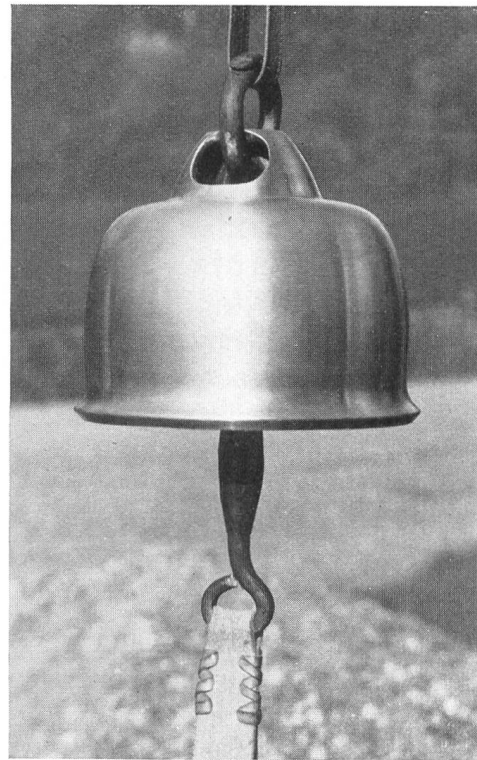
Abb. 41. Nachbildung der nebenstehenden Glocke im «Römerhaus», Augst.