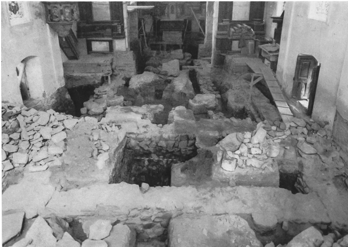
Abb. 42. Tuggen. Ausgrabungen 1958. Gesamtüberblick aus West über das Ausgrabungsfeld im Chor und Schiff der Pfarrkirche.

Ravenna, der Tuggen (Duebon oder Duchon?) in seiner Weltbeschreibung zwischen Zürich und Chur erwähnt, andererseits die Lebensbeschreibung des hl. Gallus, wonach dieser unter der Obhut des hl. Kolumban und in Begleitung weiterer Mönchsbrüder um 610 in Tuggen ein Klösterchen zu bauen und den christlichen Glauben zu predigen begann. Alsdann erscheint Tuggen in dem ums Jahr 831 aufgesetzten Reichsurbar von Chur als «Hof zu Tuggenried», zu dem 100 Joch Ackerland, an Wiesen ein Ertrag von 50 Fudern und eine Kirche mit gutem Zehnt sowie 10 Huben und eine Mühle gehörten.