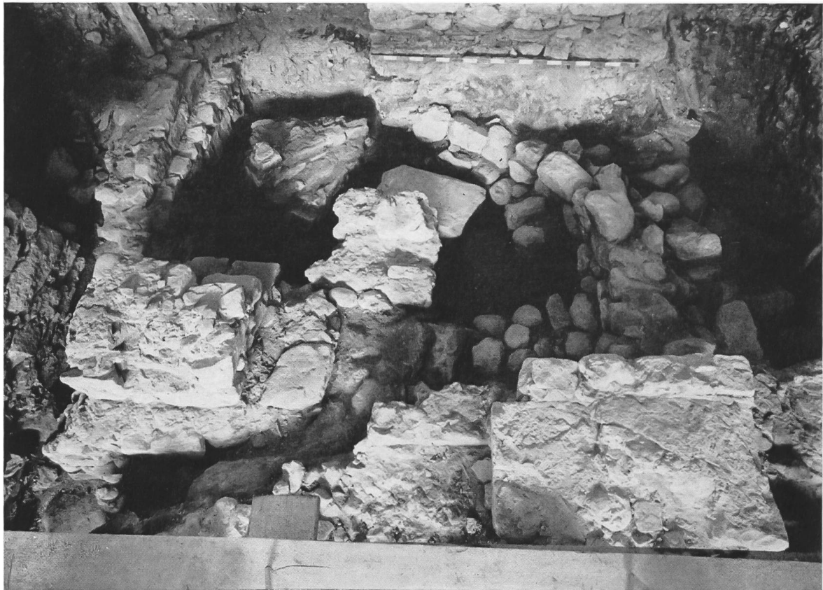
Abb. 44. Tuggen. Ausgrabungen 1958. Die im Chor freigelegten Mauerreste: die Südhälfte der Apsis der spätmerowingischen Kirche (rechts oben), ein kleiner Sektor der Apsis der romanischen Kirche (links oben), Fundamentreste der Nordmauer des gotischen Sechseckchores (links und links vorne). Im Vordergrund rechts der Sockel zum gotischen Kreuzaltar, in der Mitte die untersten Tuffsteine des quadratischen (d.h. kubischen) Altars der spätmerowingischen Kirche.

raschenderweise direkt auf der Mittelachse der Kirche. Es bestand aus den Überresten dreier männlicher Skelette, bei welchen die metallenen Überbleibsel der einstigen Wehrausrüstung lagen. Der mittlere der Bestatteten trug danach einstmals eine Spatha und einen Scramasax, die beiden zu dessen Rechten und Linken Beerdigten aber je einen Scramasax. Außerdem kamen zum Vorschein drei Feuerstahle, sowie Zierstreifen von Gürteln und vom Wehrgehänge. Soweit die im Schweiz. Landesmuseum in Zürich vorgenommenen Konservierungsarbeiten erkennen lassen, waren der Spathagriff und die metallenen Zierstücke wie Riemenzungen usw. in Treibtechnik und mittels Tauschierung mit Silber und Kupfer sehr reich verziert. Sie müssen, nach dem Stil zu urteilen, in der Zeit kurz vor 700 gearbeitet worden sein. Da der mittlere Bestattete – übrigens wohl ein Reiter (Ritter) – als Stifter der Kirche angesehen werden darf, und dieser also in der von ihm gegründeten Kirche beigesetzt