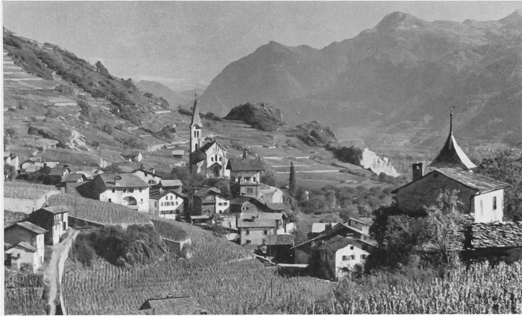
Fig. 2. Saint-Léonard et la colline de « Sur le Grand-Pré » (à droite du clocher de l'église). Vue prise en direction de l'Est environ.

révélé beaucoup de choses intéressantes la préhistoire du Valais, et d'abord l'existence du premier site d'habitation de cette région: une station néolithique, plus exactement du type de la civilisation récente de Cortaillod; or si l'on connaissait des vestiges de type néolithique en Valais, si l'on avait même des gisements importants, c'étaient dans les cas les meilleurs des cimetières, tels ceux de la Barmaz à Collombey-Muraz (distr. Monthey), où le matériel archéologique, pauvre en quantité et en qualité, ne se laissait pas aisément classer, et celui de Glis près Brigue, mal fouillé, où telle hache en silex avait suscité déjà beaucoup d'interprétations contradictoires. A St-Léonard on possède non seulement un matériel – surtout céramique – abondant, mais encore et surtout les restes curieux mais certains d'une habitation, ce qui permettra d'enrichir notre connaissance de la technique architecturale des premiers paysans sédentaires de notre pays.