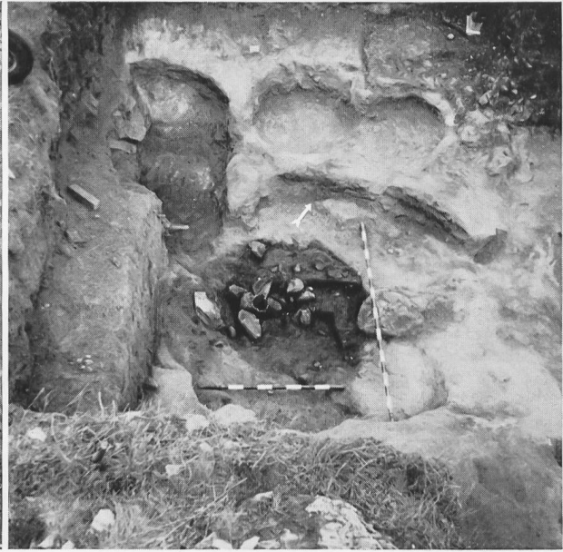
Fig. 4. Niches, banquettes et fosse centrale (celle-ci encore pleine) du fond d'habitation. Vue prise en direction NW.

parois rocheuses pour appuyer leur habitation. La stratigraphie a été malheureusement simplifiée par le défonçage d'une vigne placée là (et arrachée il y a une cinquantaine d'années), et qui a remanié et mélangé sur une épaisseur de 1 à 1,50 m les niveaux supérieurs, depuis le haut de la couche néolithique. Nous verrons que cela a détruit des documents très importants. Ce qui reste en place se compose ainsi : au fond, sur de gros blocs, du fin gravier morainique, surmonté d'une sorte de limon loëssoidé jaune très compact, dont la partie supérieure a été attaquée par les occupants néolithiques (fig. 3), dont le séjour est représenté par une couche de terre brune compacte et fine, de formation en partie éolienne, et riche en substances organiques. Elle donne l'impression d'une succession de sols, sans que l'examen attentif de sa composition permette de déceler des niveaux de détail, vu son homogénéité, due à sa formation probablement assez rapide. Elle contient par contre un assez grand nombre de cailloux – parfois groupés sans ordre apparent – amenés par l'homme.