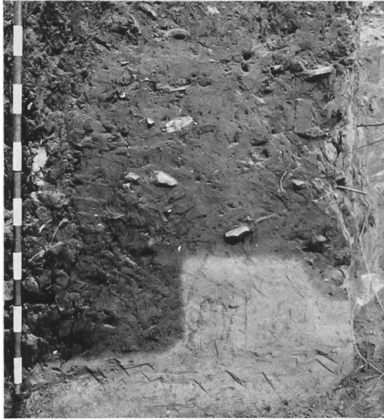
Fig. 3. Le limon jaune a été creusé très régulièrement par les Néolithiques.