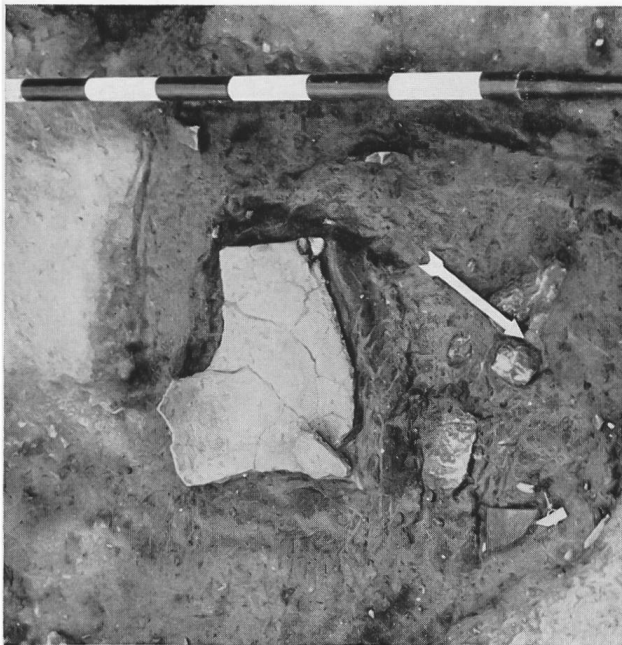
Fig. 5. Reste d'une grande jarre en place.

La céramique est plus intéressante. On peut la classer sans hésitation au niveau de celle de la civilisation récente de Cortaillod (équivalent approximatif du «Néolithique lacustre ancien» de Paul Vouga), de par sa pâte et une série de formes et de décors : jarres (nous en avons trouvé le quart d'une, bien en place, ce qui en a permis une bonne reconstitution ; fig. 5 et 6), coupes carénées, coupes et plats ; bords toujours très simples, mamelons de préhension ronds ou allongés, perforés d'un ou de plusieurs trous en général verticaux, mais parfois aussi horizontaux. Mais cette attribution doit être immédiatement