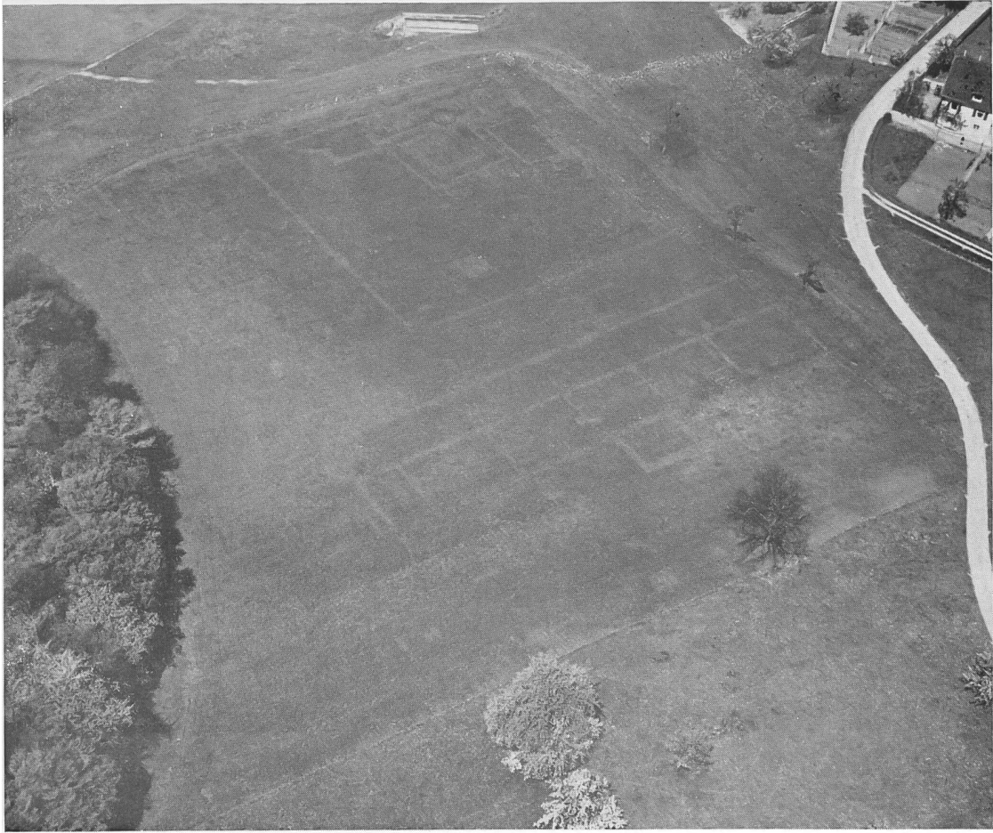
Abb. 1. Augst, Sichelen. Ansicht des Grabungsgeländes von Osten. Aufgenommen im trockenen Sommer des Jahres 1950. Römische Mauerzüge als helle Streifen sichtbar. (Swissair. Photo AG, Zürich. Archiv-Nr. 12 867).

40 m betrug die Differenz weniger als 40 cm. Außerdem lagen die Mauern so dicht unter der Oberfläche, daß man sich wundern mußte, wie der Pflug darüber hatte hinweggeführt werden können. Unter so günstigen Umständen wurde das Ausgraben zu einer wirklich spannenden Angelegenheit. Freilich hatten die Mauern stellenweise auch stärker gelitten. Dann galt es, auf jegliche Steinrümmer zu achten, die einst neben eine Mauer abgestürzt, nunmehr ihren Verlauf bezeichnen, wie das in Abb. 2 zu sehen ist. Die scheinbar zufällig daliegenden Steinbrocken rechts bilden eine scharfe Linie, die Außenkante der abgebrochenen Mauer. Für die folgende Beschreibung der Baureste sei auf den Plan (Abb. 3) verwiesen.