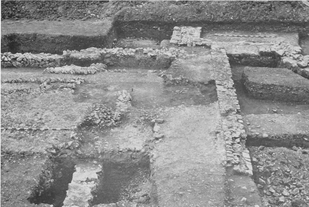
Abb. 6. Augst, Sichelen. Außenmauer mit ansetzendem Mörtelboden Periode II, im Hintergrund die nischenartige Erweiterung der Hofmauer.