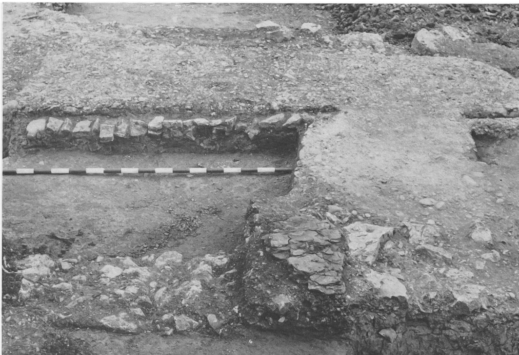
Abb. 5. Augst, Sighelen. Außenmauer mit verwittertem rotem Sandsteinblock (Portal), Abschluß des Mörtelbodens Periode I durch Steinsetzung, Ostabschnitt.