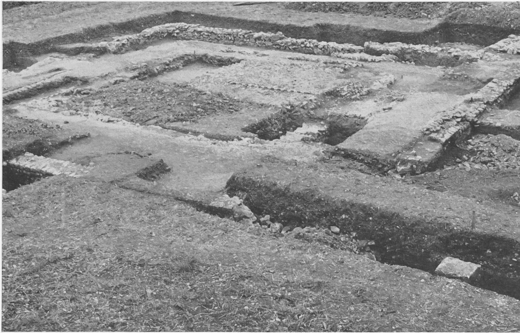
Abb. 4. Augst, Sighelen. Ansicht der Grabung von Norden, im Vordergrund rechts eine Basis der Porticus.