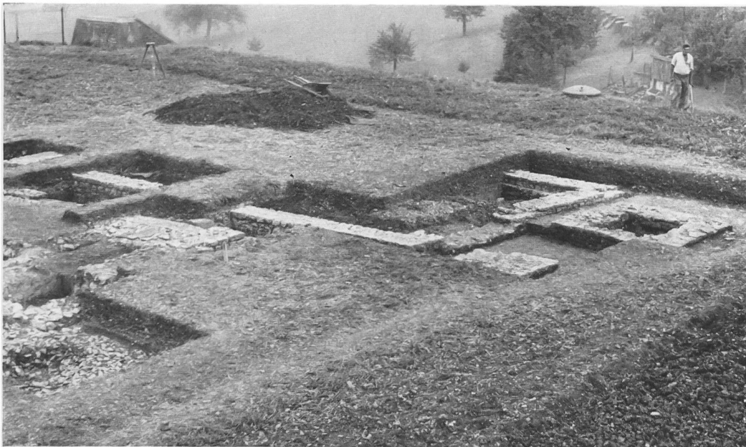
Abb. 8. Augst, Sichelen. Nebengebäude mit gemauerten Sockeln von Südosten.

Schließlich sind der Reste einer Porticus zu gedenken, die in später Zeit (oder gleichzeitig mit dem Tempelumbau?) im Tempelhof auf der Innenseite der Hofmauer errichtet wurde. Davon stammen offenbar die aufgefundenen Säulenelemente aus gebranntem Ton; die Säulen wurden aus solchen Ziegelsegmenten aufgemauert, mit einer Stuckschicht überzogen und waren darnach von massiven Steinsäulen kaum mehr zu unterscheiden, wie man das noch heute etwa in Pompeji beobachten kann. Zusammenfassend vermitteln die Baureste auf Sichelen den Eindruck von der allmählichen Entwicklung eines gallorömischen Heiligtumes: zuerst ein einfacher Vierecktempel mit offenem Umgang, dann Verbreiterung und Abschluß des Umganges durch Außenmauer, schließlich Errichtung einer Porticus unmittelbar neben dem Tempel, gleichsam als