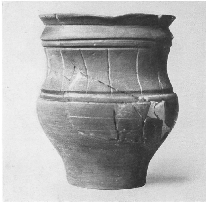
Abb. 9. Augst, Sichelen. Gurtbecher in einheimischer Technik aus dem Nebengebäude.

Ersatz für die hier fehlenden, der klassischen Bauweise eigentümlichen Säulenstellungen.