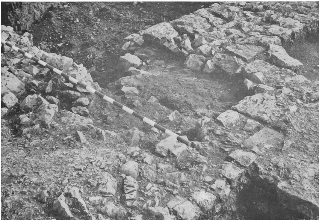
Abb. 7. Augst, Sichelen. Baufuge zwischen Nische in der Hofmauer (Periode I) und Außenmauer des Tempels (II, links im Bild).