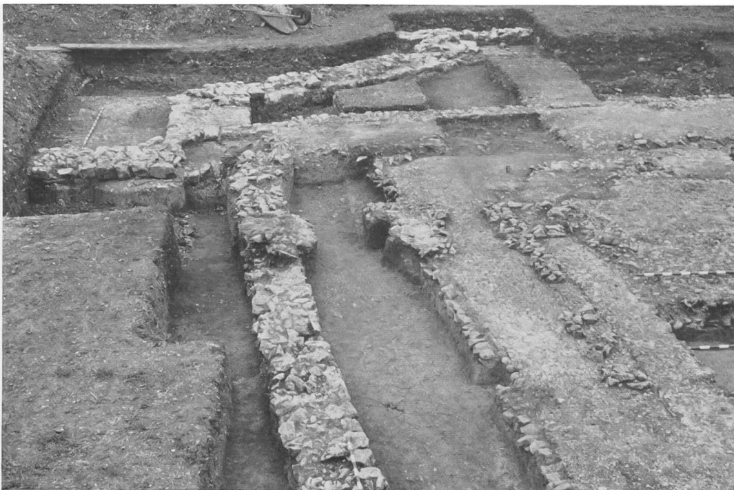
Abb. 2. Augst, Sichelen. Außenmauer, Mörtelboden (I) und Cellawand (durch Steintrümmer markiert) im Südabschnitt der Grabung.

Rings um die Cella zog sich ein Umgang, bestehend aus einem kiesigen Mörtelboden, der stellenweise – im Gegensatz zum Cellaboden – seine ursprüngliche, geglättete Oberfläche bewahrt hatte und offenbar aus der gleichen Zeit stammt wie die Cella. Weiter außerhalb wurde ein zweites Mauerviereck festgestellt, dessen geringere Fundamentierung und unregelmäßiger Verlauf (Knick im Südwesten) es deutlich von der Cella-Mauer unterschieden. Infolge ihrer schlechteren Ausführung senkte sich diese Außenmauer etwas, wodurch ein Teil des aufgehenden Mauerwerkes erhalten blieb. Es bestand aus behauenen Kalksteinen, mit gelegentlicher Verwendung roten Sandsteins. Zudem ließ sich an den abgesunkenen Stellen ein zweiter Mörtelboden beobachten, der auf der inneren Seite der Mauer ansetzte. Während nun der erste Mörtelboden etwa in der Mitte des Umganges durch eine Steinsetzung abgeschlossen war, erstreckte sich der zweite Boden, über den ersten hinweg in der ganzen Breite von Mauer zu Mauer (Abb. 5 und 6). Die Erklärung dieses merkwürdigen Befundes liegt darin, daß der Umgang des Tempels einmal verbreitert und nachträglich mit dieser Umfassungsmauer versehen worden ist. Für den Tempel sind