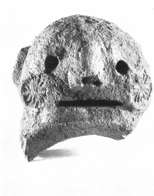
Abb. 35. Messen. Firstziegel, Vorderansicht.