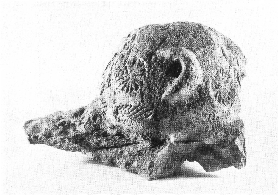
Abb. 37. Messen. Seitenansicht mit umgekehrtem Ohr.