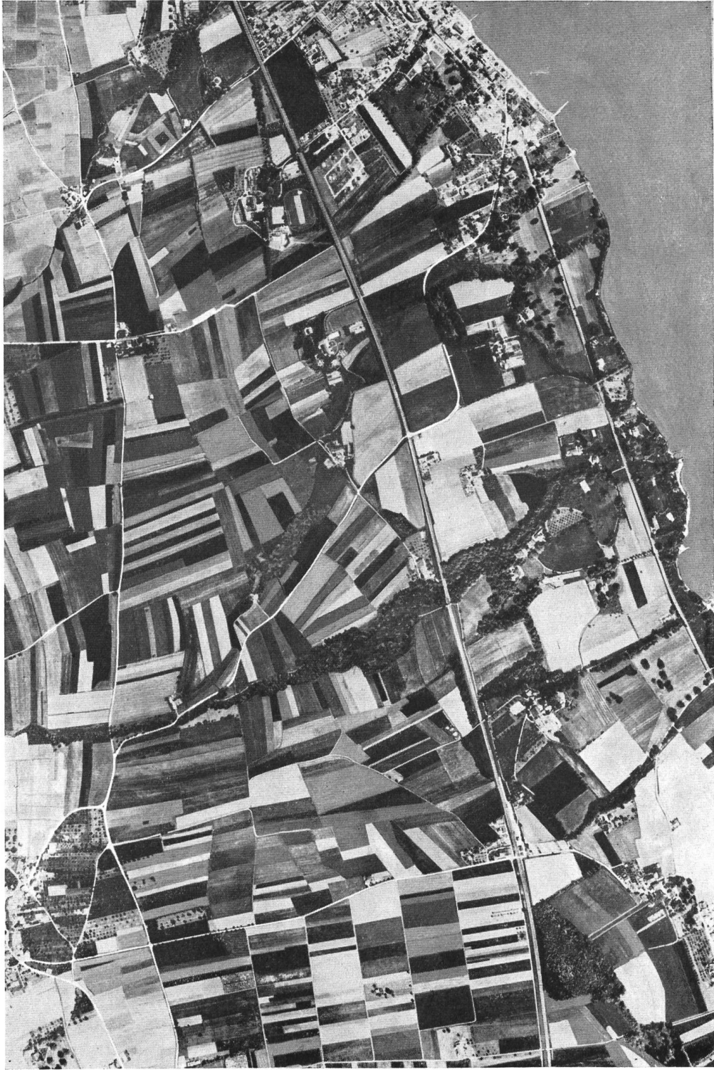
Fig. 1. Autoroute Lausanne-Genève. Syndicat no. 7 (Gilly). Etat avant le remaniement parcellaire.