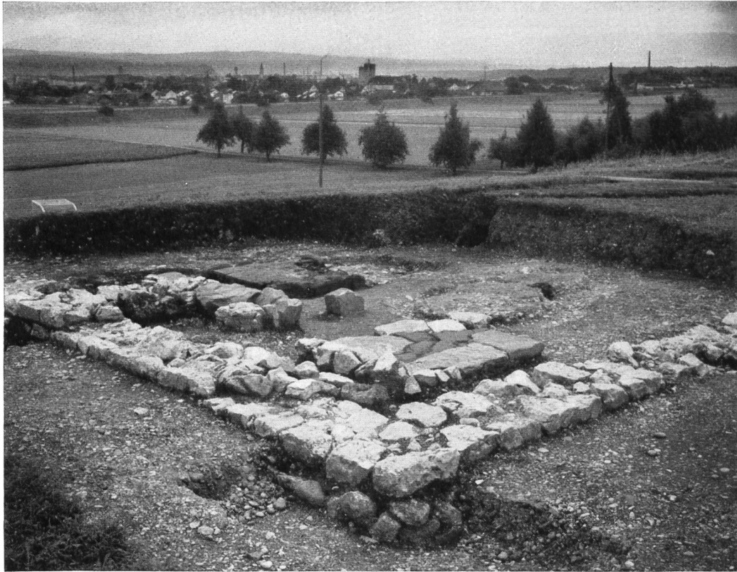
Abb. 49. Rheinfelden, Görbelhof. SW-Ecke eines Wirtschaftsgebäudes der römischen Villa. Blick von der Niederterrasse auf das Vorgelände gegen Rheinfelden.