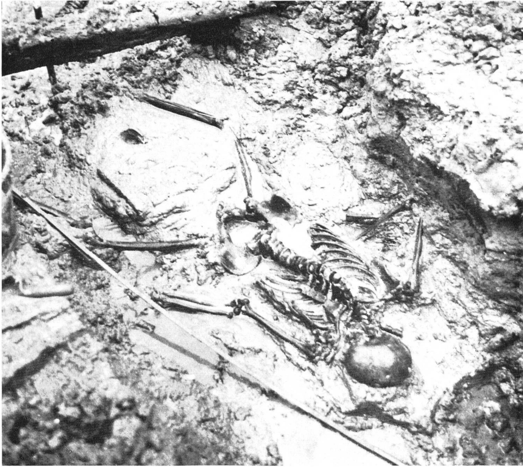
Abb. 6. Cornaux, NE. Keltisches Skelett.