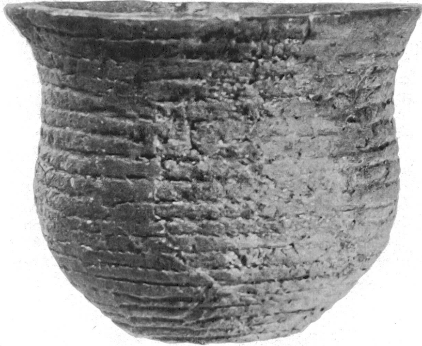
Fig. 8. Vase campaniforme avec décor «à la corde».