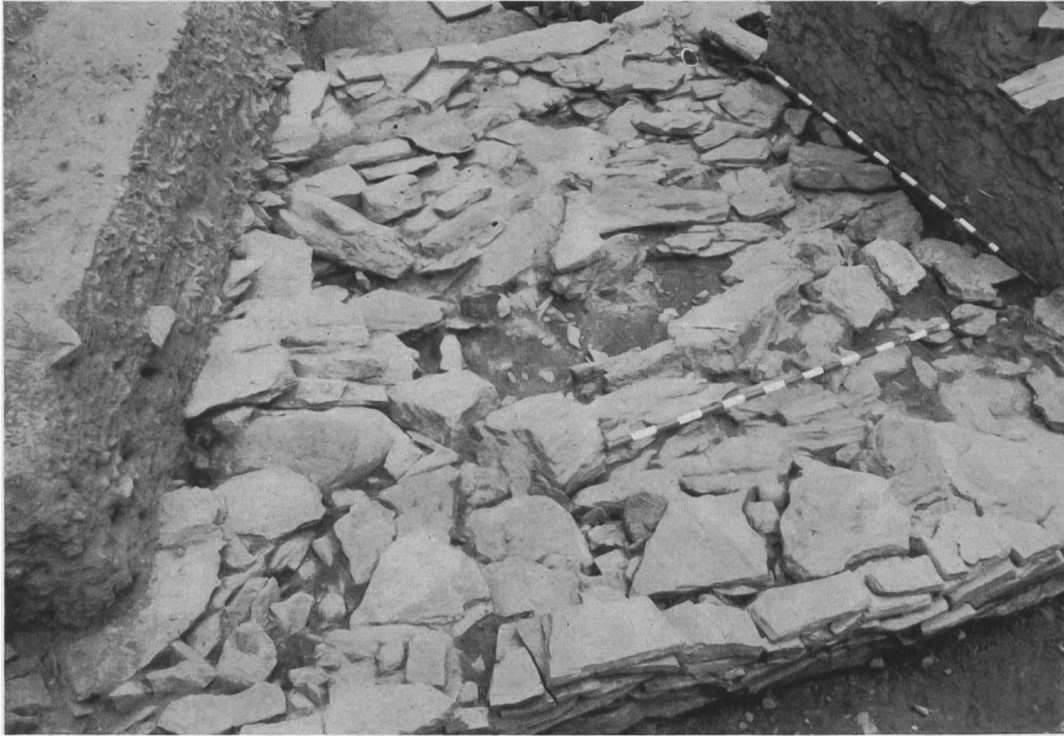
Fig. 9: Sion Petit-Chasseur. Dallage au nord du ciste VI avec trou de poteau ou de menhir.