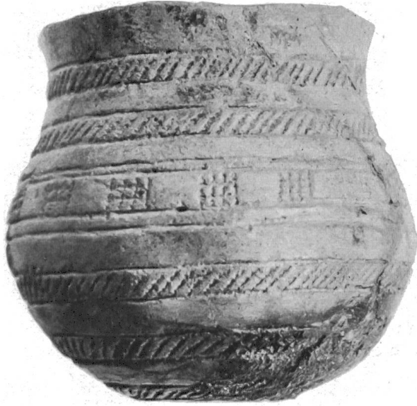
Fig. 7. Sion, VS. Petit-Chasseur. Vase campaniforme avec décor zoné et métopes.