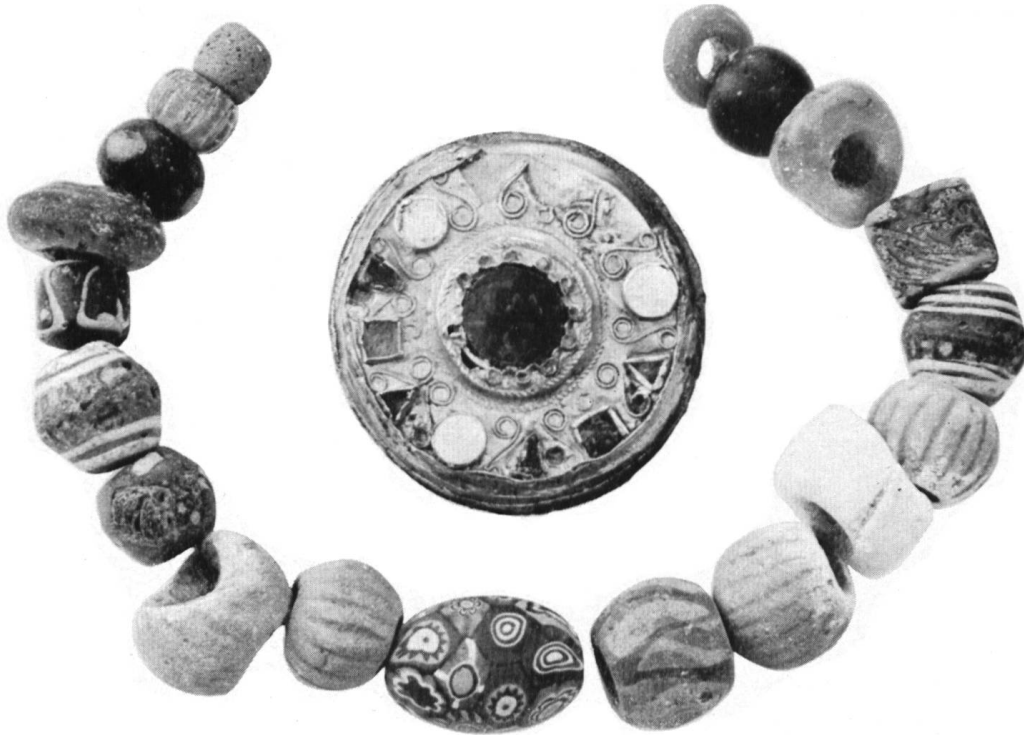
Fig. 2. Torclens VD. Fibule d'or cloisonné avec filigranes. Les cloisons contiennent trois pastilles de nacre et des verroteries rouges et vertes. L'élément central, rouge, est reconstitué. Le collier est formé de pâtes de verre ou de céramique. L'une des perles est de craie. 1:1.

dernière inhumation, l'état de conservation des os était tel qu'il fut impossible de déterminer exactement la position des mains et des bras. Toutes les sépultures sont simples. L'alignement des tombes n'est pas rigoureux.