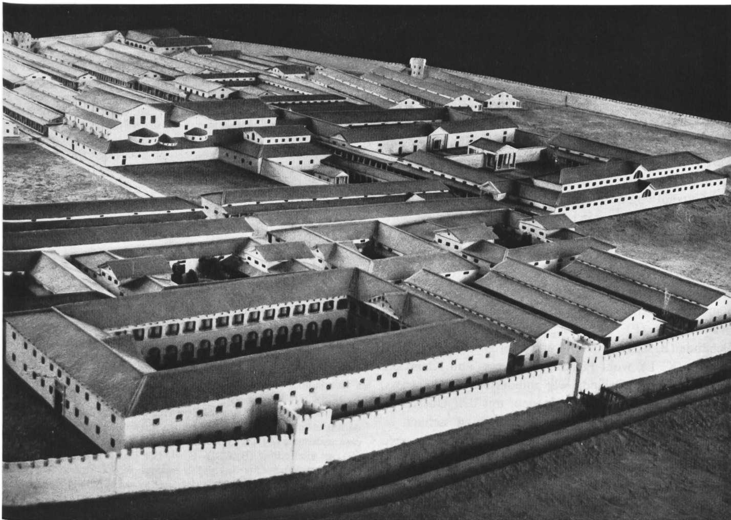
Vindonissa. Ausschnitt aus dem Lagermodell im Vindonissa-Museum. Vindonissa. Musée de Vindonissa: détail du modèle du camp romain. Vindonissa. Particolare del modello del campo romano.

Il villaggio del campo (Canabae), sorto nelle vicinanze della sede della guarnigione, andò trasformandosi con il tempo in un piccolo centro cittadino. Di esso si conoscono fino ad oggi tra l'altro la piazza del mercato (Forum) e l'anfiteatro, oltre a templi gallico-romani, numerosi cimiteri, diversi impianti industriali, come forni di cottura per calce e mattoni, nonché due condutture per l'acqua. Un particolare punto di attrazione è costituito dall'anfiteatro, oggi riportato alla luce e conservato. È a forma ellittica, i cui assi misu-