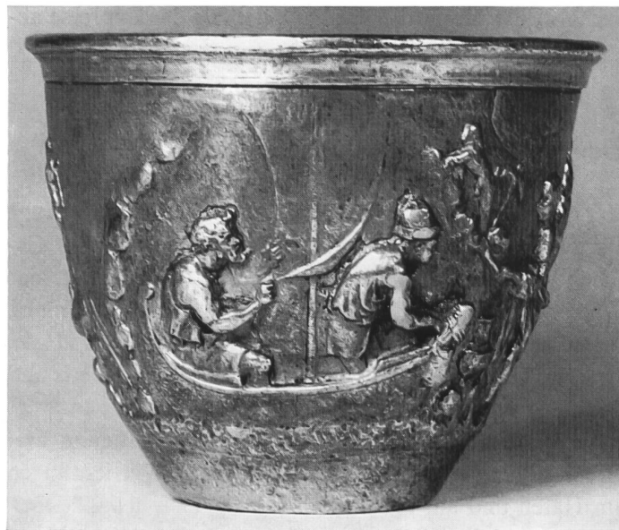
Höhe 79 mm.

Figuren A und B füllt das Hinterteil des in flachem Relief angegebenen Schiffes, dessen Rumpf hinter den beiden Handwerkern verschwindet. Diese arbeiten emsig am Kahn; vielleicht haben sie ihn eben erbaut und legen jetzt die letzte Hand an, oder sie bessern schadhafte Stellen aus, um das Boot für eine baldige Ausfahrt zu rüsten. Der Mast ist noch nicht aufgerichtet. Im Hintergrund steht eine Säule oder ein Pfeiler mit einem Abschlussprofil. Der daraufstehende Gegenstand ist schwer zu deuten; es könnte sich um ein Gefäß handeln, wie öfters auf pompejanischen Wandgemälden, oder um eine Sonnenuhr. Den rechten Abschluss der Szene bildet auch hier, wie auf der Gegenseite, ein kleines Heiligtum. Hinter aufeinandergeschichteten Felsbrocken windet sich ein knorriger Baumstamm mit zwei blattlosen Ästen hervor. Eine Votivtafel und ein Ruder lehnen an der runden Basis der Kultstatue, die den bockbeinigen, bärtigen Gott Pan darstellt. Er scheint zu tanzen oder weit auszusprechen und hält in den vom Körper abgestreckten Händen links das Wurfholz für die Hasenjagd und ein Fell, rechts wohl