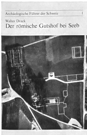
1: Der römische Gutshof bei Seeb , von Walter Drack 32 Seiten, 33 Abbildungen und Pläne. Preis: Fr. 2.50* Verkaufsstelle: Römervilla Seeb