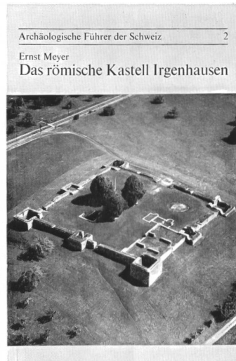
2: Das römische Kastell Irgenhausen , von Ernst Meyer 20 Seiten, 23 Abbildungen und Pläne. Preis: Fr. 2.-* Verkaufsstelle: Pfäffikon-Irgenhausen